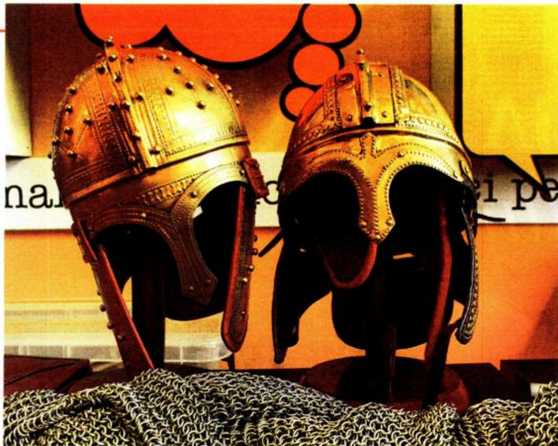
Jutro u muzeju, Rimski svakodnevica

stručno vodstvo po stalnom postavu koji će sve zainteresirane provesti Tea Perinčić, muzejska savjetnica i otkriti tajne o snažnim ženama koje su nenametljivo, a samouvjerenom činile male, a velike promjene u životu našega grada.