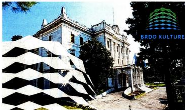
Brdo kulture, logo