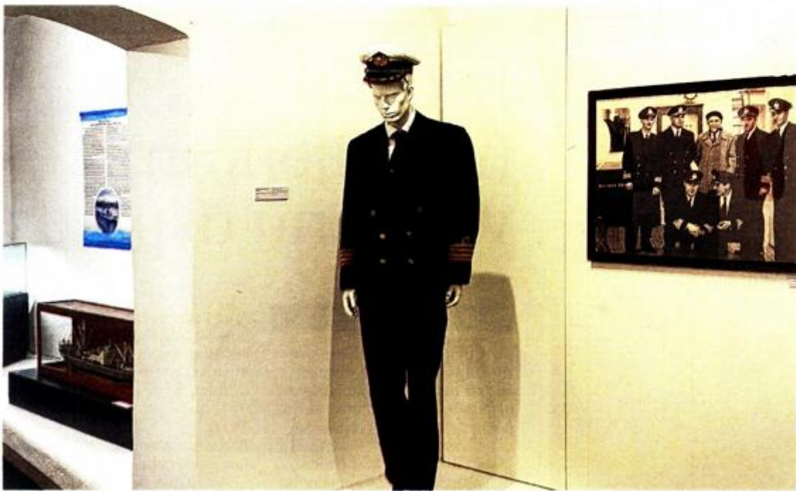
Priče plavog horizonta, Jugolinija 75 godina

INFO Trg Riccardo Zanelle 1 HR-51 000 Rijeka uprava@ppmhp.hr ; info@ppmhp.hr Lokacija Guvernerova palača Trg Riccardo Zanelle 1 Radno vrijeme: ponedjeljak od 9 do 16, utorak – subota od 9 do 20, nedjelja od 9 do 13 sati. Muzej je praznicima i blagdanima zatvoren. http://ppmhp.hr/ Svakog četvrtka ulaz u PPMHP Rijeka na svim lokacijama je slobodan.