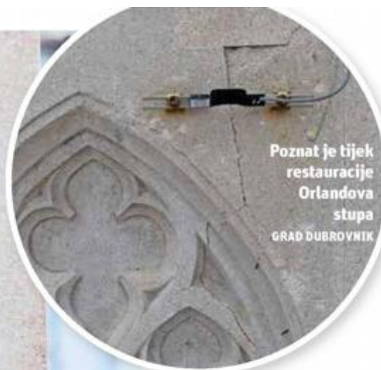
Poznat je tijek restauracije Orlandova stupa GRAD DUBROVNIK