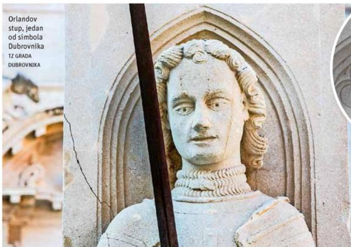
Orlandov stup, jedan od simbola Dubrovnika TZ GRADA DUBROVNIKA