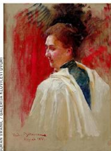
PORTRET GDE JANUSIĆ

Petra Vugrinec, nadalje, opisuje ovo djelo: "Bukovac će prizor smjestiti u ambijent predvorja antičkog hrama čiji arhitrav nose kanelirani mramorni stupovi dekoriranih kapitela u duhu historicističkog eklekticizma. Podno trijema hrama lebdi osam vila. Trabeacija je ukrašena obojenim triglifima i metopama friza na kojima su reljefno istaknuti maskeroni komedije i tragedije. Elementi arhitek-