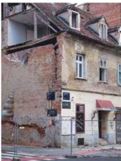
Zgrada na uglu Dordičeve i Petrinjske, 16. 3. 2022.