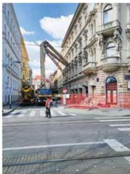
Radovi pokraj hotela Palace u Katančićevoj ulici, 8. 3. 2021.