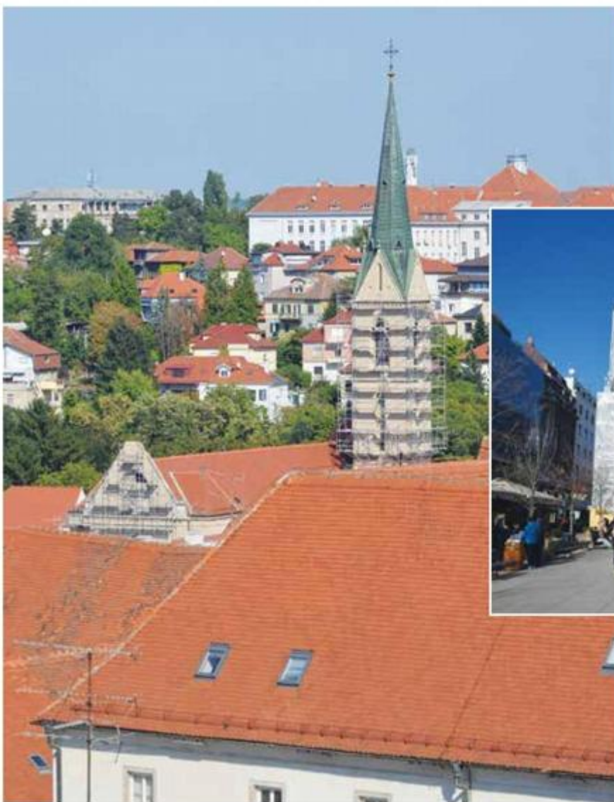
Toranj i glavno pročelje franjevačke crkve na Kaptolu pod skelama, 12. 9. 2021.