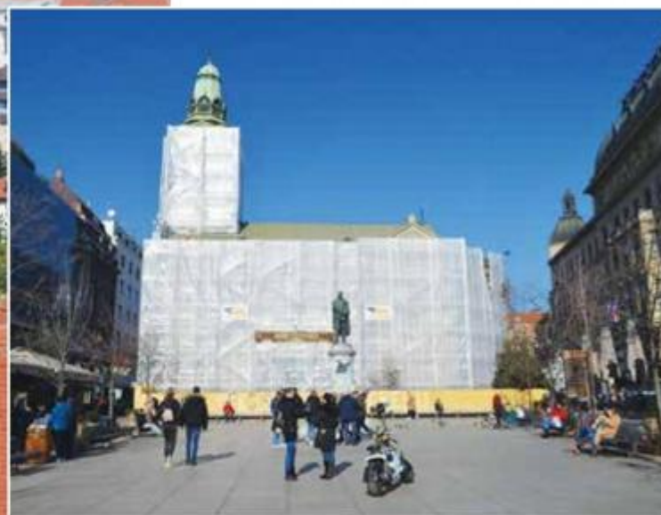
Pravoslavna crkva Preobraženja Gospodnjeg na Preradovićevom trgu pod skelama, 13. 2. 2022.