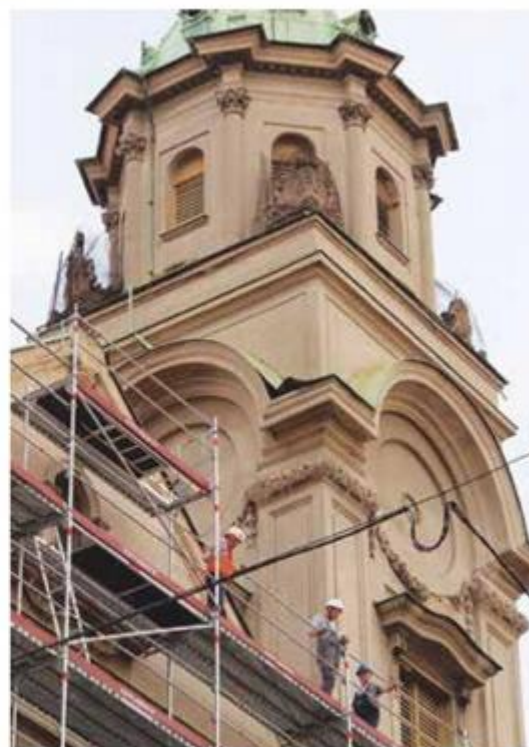
Radovi na tornju isusovačke crkve Srca Isusova u Palmotičevoj ulici, 28. 7. 2021.