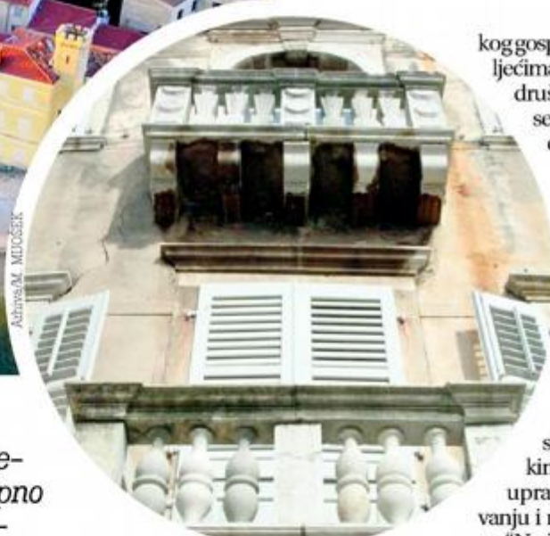
Palaca Sinčić Poreč

Za provedbu projekta konzorciju koji čine Gradska knjižnica i Grad Poreč odobrena su bespovratna sredstva u iznosu od 2.132.819 kuna, u sastavu Operativnog programa Učinkoviti ljudski potencijali 2014.-2020. Priredila V. BEGIĆ