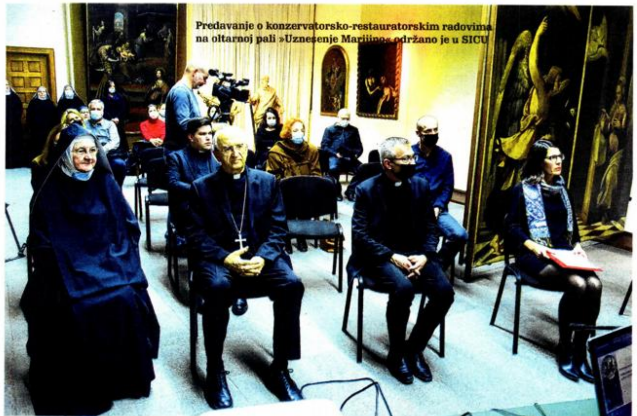
Predavanje o konzervatorsko-restauratorskim radovima na oltarnoj pali »Uznesenje Marijino« održano je u SICU

- O životu i djelu Lorenza Luzzza imamo vrlo malo arhivskih podataka. Prvi se put spominje 1511. godine u Zadru, gdje se smatra kako je bio uvaženi građanin. Umro je 1526. godine. Ono što je zanimljivo jest kako postoji samo jedno njegovo potpisano djelo. To je »Bogorodica između sv. Viktora i sv. Stjepana«, koja se čuva u Berlinu. Taj je potpis bio ključan da se ova zadarska