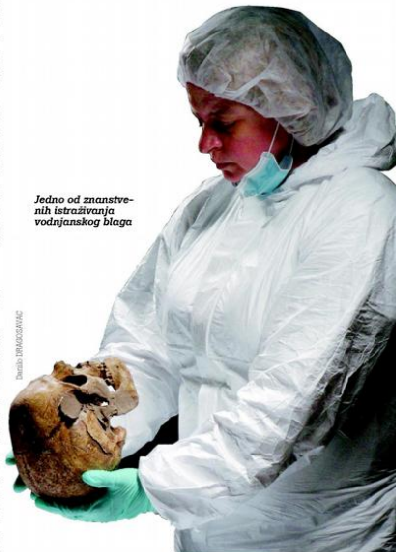
Jedno od znanstvenih istraživanja vodnjanskog blaga