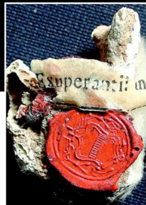
Relikvija Sv. Egzuperancija ovjerena pečatom

- Da. Bio je akademski slikar, nije bio kolekcionar nego je, rekao bih, osjećao odgovornost. Naime, francuski su vojnici u Veneciju stigli 1810. godine i profanirali i uništili 120 crkava. Vojsku nitko nije mogao zaustaviti. Gressler je želio spasiti barem relikvije. Od upravitelja crkava preuzimao je relikvije i potajno ih čuvao u svojoj palači Lezze. Ondje je relikvije "sredio", vlastoručno na pergameni ispisao imena svetaca. Nekoliko puta godišnje pozivao je prijatelje u palaču na molitvu kada su se zbivali čudesni događaji. Jednom ga je jedna gospoda zamolila da makne cvijeće jer su joj