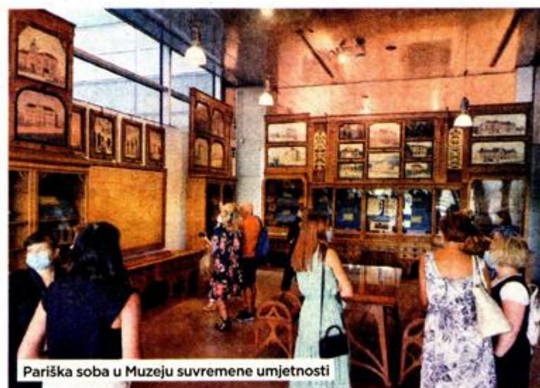
Pariška soba u Muzeju suvremene umjetnosti

UZ RAZGLEDAVANJE PARIŠKE SOBE U MUZEJU SUVREMENE UMJETNOSTI BIT ĆE ORGANIZIRANE I RADIONICE ZA UČENIKE, A SVAKE PRVE SRIJEDE U MJESECU, POČEVŠI OD 6. LISTOPADA, OD 17 DO 19 SATI POSJETITELJI ĆE MOĆI SAZNATI VIŠE O PARIŠKOJ SOBI OD STRUČNIH DJELATNIKA ŠKOLSKOG MUZEJA