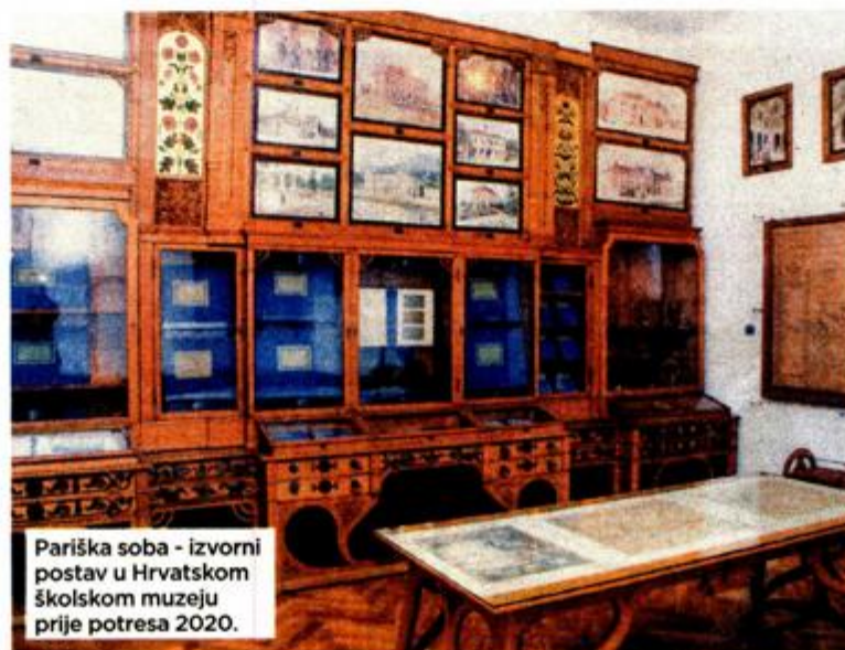
Pariška soba - izvorni postav u Hrvatskom školskom muzeju prije potresa 2020.