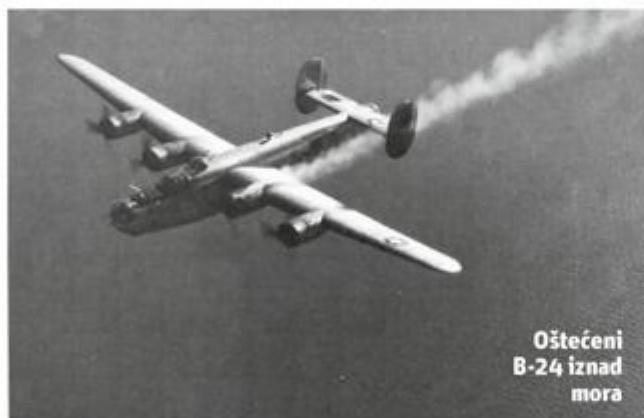
Oštećeni B-24 iznad mora

Drugi poručnik, tada 25-godišnji Ernest živio je izgubio 6. studenoga 1944. godine kada je bombarder B-17 pogoden iznad Maribora. Vjeruje se da su ga ostali članovi posade sklonili iza pilotske kabine kako bi ga zaštitili prilikom prisilnog slijetanja aviona u viški akvatorij s obzirom na to da je otočni aerodrom bio zauzet. Oni su preživjeli, ali poginulog druga nisu uspjeli izvući i tako je njegova