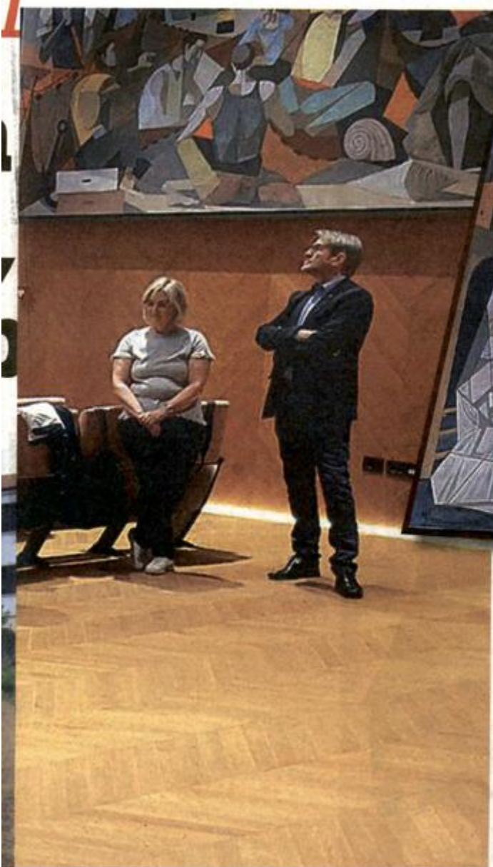
Iz Mascarellijevoj "Novigradskog ciklusa"

“Novigradske slike” nastaju 1952. i na njima se odražava poslijeratni duh pobjede, uzleta i optimizma. No, Mascarelli ne bježi i od tragičnih trenutaka tih godina u Istri pa se na slikama, u detaljima, zapažaju i ti elementi, kao što su napuštene kuće zbog egzodusa stanovništva, ali jednako tako oslikava kroz nova zdanja i duh obnove, novi život koji je na pomolu, pa se njegove slike mogu promatrati kao šaroliki rebus, odnosno puzzle što se slažu u veliku formativnu kompoziciju autentičnog Novigrada tj. njegovih stanovnika jučer i danas”