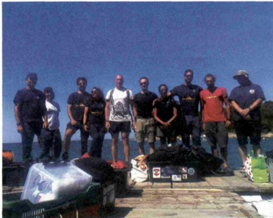
Istraživački arheološki tim

- Brodovi se već desetljećima pljačkaju. Prošle smo godine ovdje