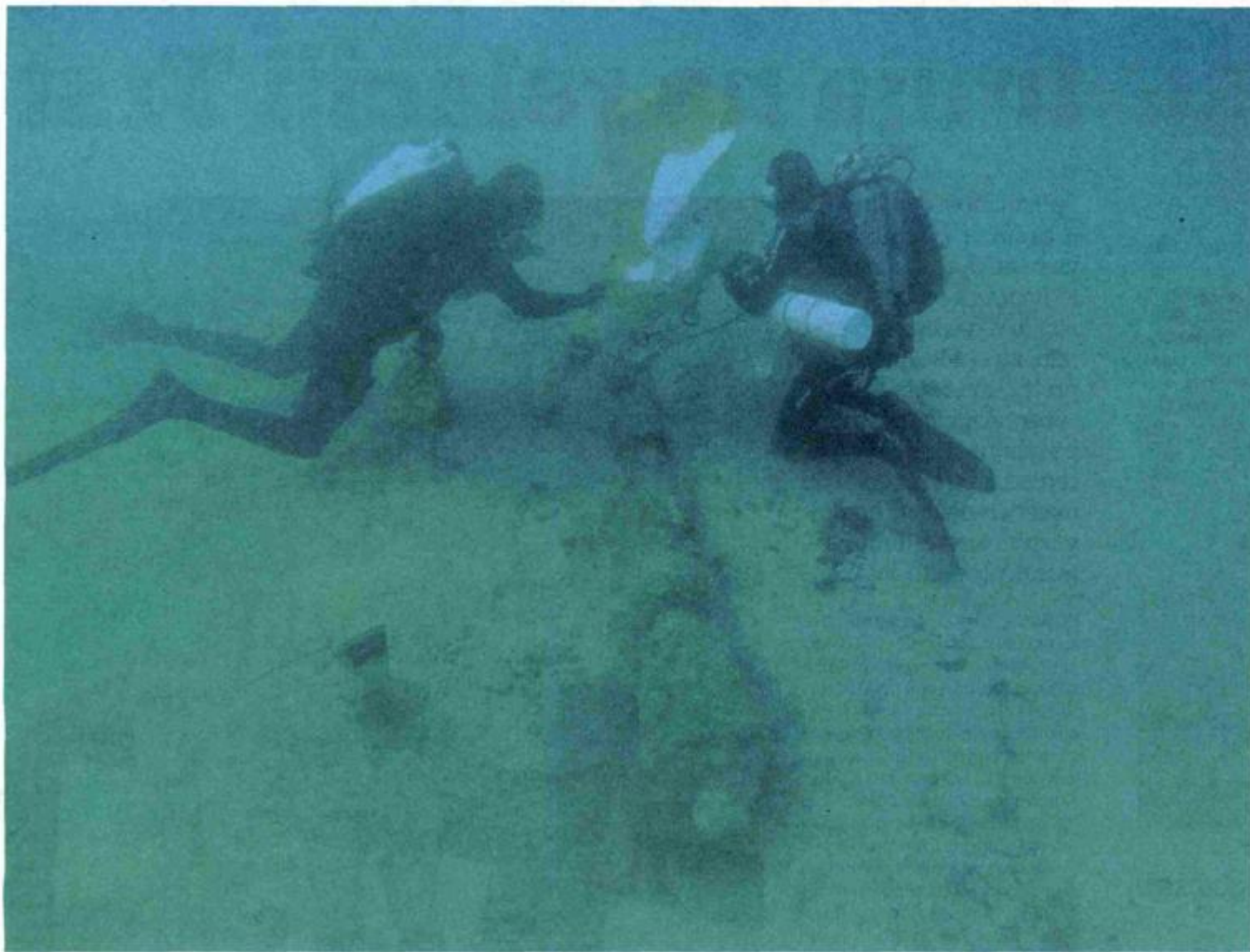
Pronađeni top od lijevanog željeza značajno je otkriće