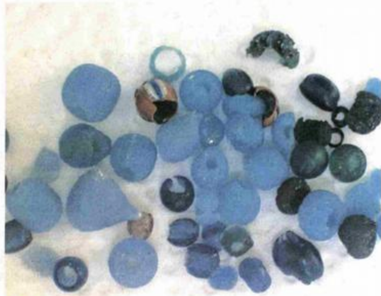
Pronađeni stakleni eksponati

Dolazak na teren je pokazao da su pljačkaši dosta toga odnijeli i ostavili krhotine.