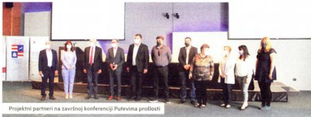
Projektne partnere na završnoj konferenciji Putevima prošlosti

uvelike ojačao konkurentnost Obrta i suradnju s Gradskim muzejom Korčule, a posebno ponudu i prezentaciju tradicionalnih vještina. Turistička agencija Dominium travel nabavila je vozilo te će kreirati turističke aranžmane za nove ruralne lokacije. Ukupni prihvatljivi troškovi iznose 32.645.708,48 kuna, od čega je bespovratna sredstva u iznosu od 27.748.345,48 kuna sufinancirala Europska unija iz Europskog fonda za regionalni razvoj. Projekt se provodi kroz Operativni program Konkurentnost i kohezija 2014.-2020.