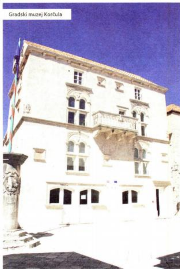
Gradski muzej Korčula