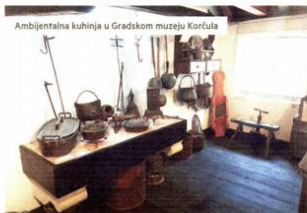
Ambijentalna kuhinja u Gradskom muzeju Korčula

PROJEKT 'RURALNA POUČNA, KULTURNO-ETNOGRAFSKA turistička atrakcija' u sklopu kojeg su ostvarene značajne obnove i revitalizacije spomenika kulturne baštine diljem Dubrovačko-neretvanske županije došao je svom kraju. Nositelj ovog projekta, koji se brendira pod nazivom 'Putevima prošlosti' je Dubrovačko-neretvanska županija, a operativno ga je provela Regionalna agencija DUNEA s još 10 partnera. Projekt vrijedan više od 32 milijuna kuna započeo je još 2017. godine te iza sebe ostavlja vrijedna kulturna dobra s digitalnim pristupom baštini, ali i temelje za nastavak ulaganja u kulturno-turističke destinacije ruralnih i udaljenih područja županije. Uz Dubrovačko-neretvansku županiju i Regionalnu agenciju DUNEA, na projektu je sudjelovalo još 10 partnera – Grad Korčula, Korčulanska razvojna agencija KORA, Općine Šmokvica, Dubrovačko primorje i Mljet, Sveučilište u Dubrovniku, Hrvatski