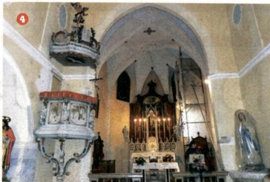
3 Fragment- rep nekakve nemani