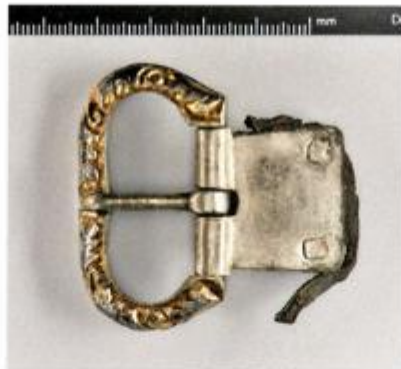
Dio konjaničke opreme – nalaz iz kneževskoga groba u Bojni © Marijana Krmpotić, Hrvatski restauratorski zavod.