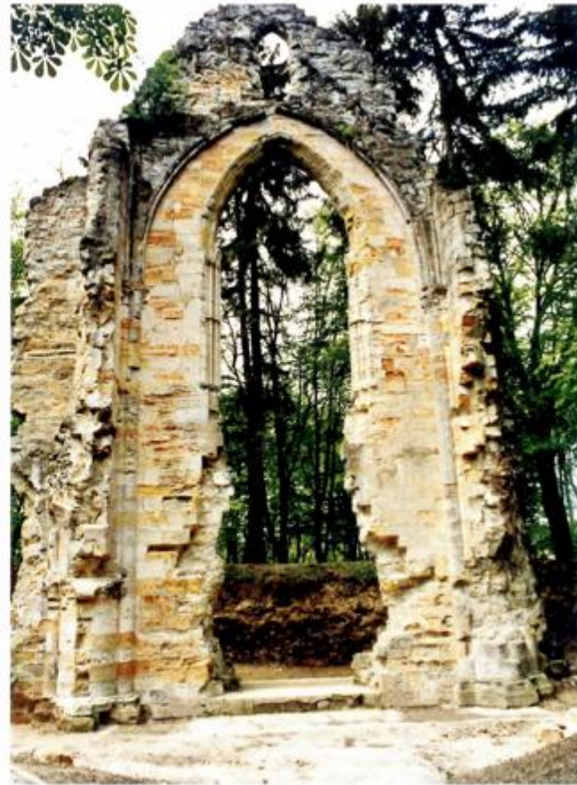
Ostatci cistercitske opatije u Topuskom

Vrijeme nasilja i borbe oko nasljedstva nakon smrti Ludovika Velikog, poznato kao protudvorski pokret na prijelazu iz 14. u 15. stoljeće unijelo je i na taj prostor nesigurnost i gospodarsko pustošenje od strane prvo bosanskih četa Hrvoja Vukčića Hrvatinića, a potom i Osmanlija. Vjeruje se da redovnici privremeno napuštaju samostan početkom 15. stoljeća pa otad opatija uglavnom ima svjetovnog uprave-