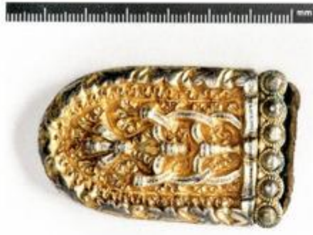
Dio konjaničke opreme – nalaz iz kneževskoga groba u Bojni © Marijana Krmpotić, Hrvatski restauratorski zavod.