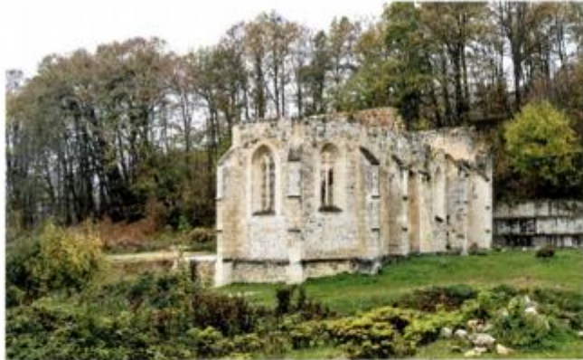
Ostatci crkve Marije Magdalene, Zrin