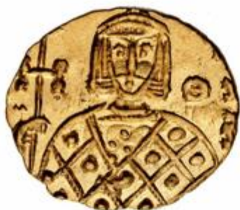
Bizantski zlatnik – nalaz iz kneževskoga groba u Bojni