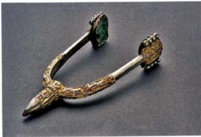
Ostruga – nalaz iz kneževskoga groba u Bojni © Marijana Krmpotić, Hrvatski restauratorski zavod.