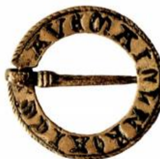
Nalaz iz Gore

pa je kao takva i rekonstruirana makar ju je, nažalost, zadnji potres ponovno jako ošteti. Riječ je o crkvi koju je na mjestu prijašnje romaničke podignuo viteški red templara u 13. stoljeću, a kojima je posjed i trgovište u Gori dao još u 12. st. kralj Bela III. Gora je tako postala jedan od najstarijih templarskih posjeda u hrvatskim krajevima i sjedište preceptora – templarskog poglavara odgovorna meštru provincije. Tijekom 13. stoljeća spominje se više gorskih preceptora, podrijetlom Francuza. I sinovi Bele III., kraljevi Emerik i Andrija II. daju templarima povlaštenu pravni položaj unutar kraljevstva te ih daruju dodatnim posjedima, iako će osnivanje cistercijskog samostana u Topuskom uz potporu Andrije II. dovesti nekoliko godina kasnije do razmirica oko posjeda Gorske županije između templara i cistercita. Prilikom zadnjih arheoloških istraživanja u grobovima oko crkve u Gori nađen je i novac, srebrni i kositreni nakit (prstenje, broš s natpisom koji zaziva zaštitu Djevice Marije) te dijelovi opreme koji svjedoče o vremenu nazočnosti templara i ivanovaca u Gori.