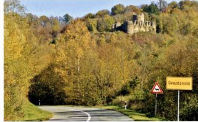
Gvozdansko @ Tajana Pleše, 2013.

seljaka i rudara sa ženama i djecom pod zapovjedništvom satnika Damjana Doktorovića, Jurja Gvozdenovića, Nikole Ožegovića i Andrije Stepšića – protiv u konačnici 10000 osmanlijskih vojnika bosanskog sandžakbega Ferhad-paše Sokolovića potpomognutih vlaškim pomoćnim četama, Gvozdansko je ušlo u povijest. Nakon tromjesečne opsade branitelji, makar ostavši bez zaliha i u velikoj hladnoći, odbijali su se predati. Konačno, kad je u zoru 13. siječnja 1578. nakon zastrašujuće hladne noći Ferhad-paša s vojskom ušao u grad u kojem su se u noći ugasile sve vatre, zatekao je gotovo sve branitelje i obitelji smrznute i umrle od gladi. Potresen tim prizorom, dao je pozvati svećenika i kršćanski ih pokopati uz počasti. Konačnim preuzimanjem Gvozdanskog Osmanlije ruše i obližnje rudnike.