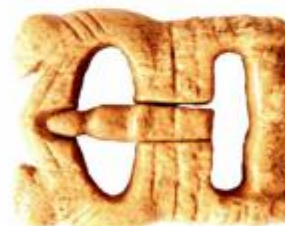
Nalaz iz Gore