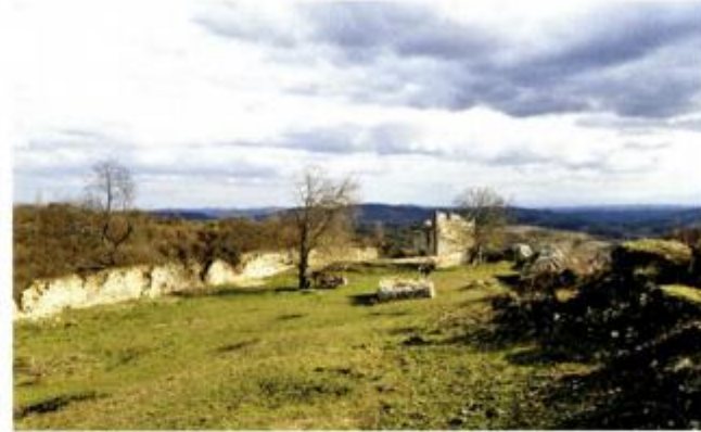
Zrin @ Tajana Pleše, 2013.

njemu središte satnije Vojne krajine. U cijelosti je napušten nakon požara početkom 19. stoljeća, a obnovljen je djelomično 1925. Posljednja velika devastacija Zrina dogodila se u Drugom svjetskom ratu 1943., kada su ga partizani gadali topovskim granatama, a posebno je teško stradala, oštećena dinamitom, južna kula.