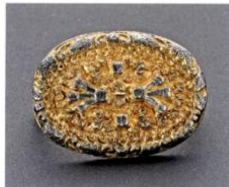
Dio konjaničke opreme – nalaz iz kneževskoga groba u Bojni

ugled nekadašnje biskupije. Početak je to i ponovne kristijanizacije tog prostora pod vrhovnom paskom akvilejskog patrijarha, makar o tome nema baš puno lokalnih svjedočanstava. Prvi pouzdano zasvjedočeni knez donjopanonskog prostora bio je Ljudevit, koji 819. nakon neuspješne žalbe caru Ludoviku na nasilja markgrofa Kadolaha podiže veliki ustanak. Nakon početnih uspjeha tijekom kojih je negdje u blizini Banovine na Kupi potukao dalmatinskoga kneza Bornu i prodro na njegov teritorij, idućih je nekoliko godina odolijevao franačkim vojskama defanzivnim taktikama. Tako se u franačkim analima spominje da se 820. godine Ljudevit sklonio pred trima franačkim vojskama »u utvrđeni grad na strmom brdu«, u kojem neki prepoznaju Hrastovicu, Zrin ili Staru Petrinju, a u obzir dolaze i druge lokacije kasnijih utvrda u Banovini, možda u Gori ili Bojni. Postupno gubeći saveznike, a vjerojatno i potporu podanika zbog franačkih pustošenja, Ljudevit je 822. pobjegao, vjerojatno u sjeveroistočnu Bosnu, da bi iduće godine bio ubijen.