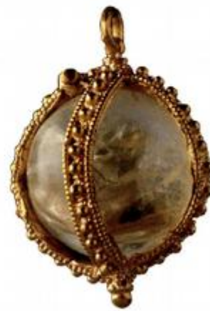
Privjesak s gorskim kristalom – nalaz iz kneževskoga groba u Bojni © Marijana Krmpotić, Hrvatski restauratorski zavod.

preciznije razdjelnicom Zrinske gore, prolazila i granica između rimskih provincija Dalmacije i Panonije.