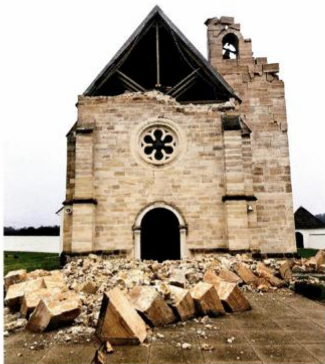
Crkva sv. Marije u Gori