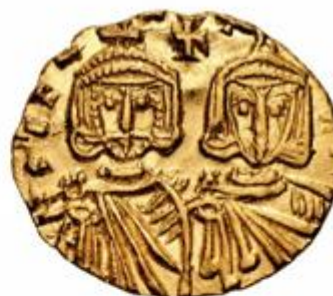
Bizantski zlatnik – nalaz iz kneževskoga groba u Bojni © Marijana Krmpotić, Hrvatski restauratorski zavod.