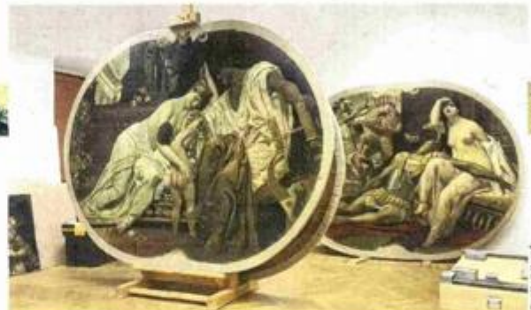
U riječkom odjelu Hrvatskoga restauratorskog zavoda obnovljeno je šest slika – tri velika platna Gustava Klimta i tri manja Franza Matscha. U Odjelu za štafelajno slikarstvo Hrvatskoga restauratorskog zavoda u Zagrebu obnovljene su slike Ernsta Klimta