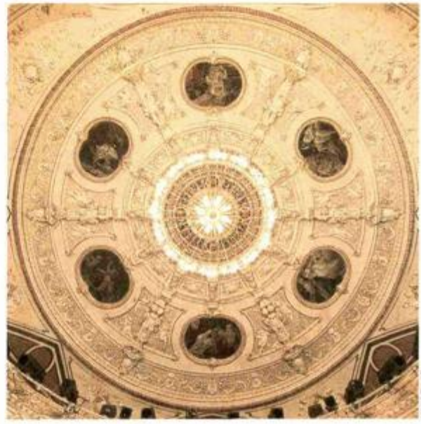
Slike Gustava Klimta, Ernsta Klimta i Franza Matscha od 1885. godine dekoracija su svoda gledališta riječkoga kazališta, a od 20. travnja vrijedi ih vidjeti na izložbi u Palači Sečerahe