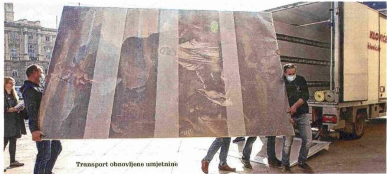
Transport obnovljene umjetnine

Na slici je sv. Franjo okružen mnoštvom koje traži njegovu pomoć: bolesni koji mole ozdravljenje, mladić kojega je svetac oživio i nekolicina znatiželjnika dio su prizora smještenog na stijene