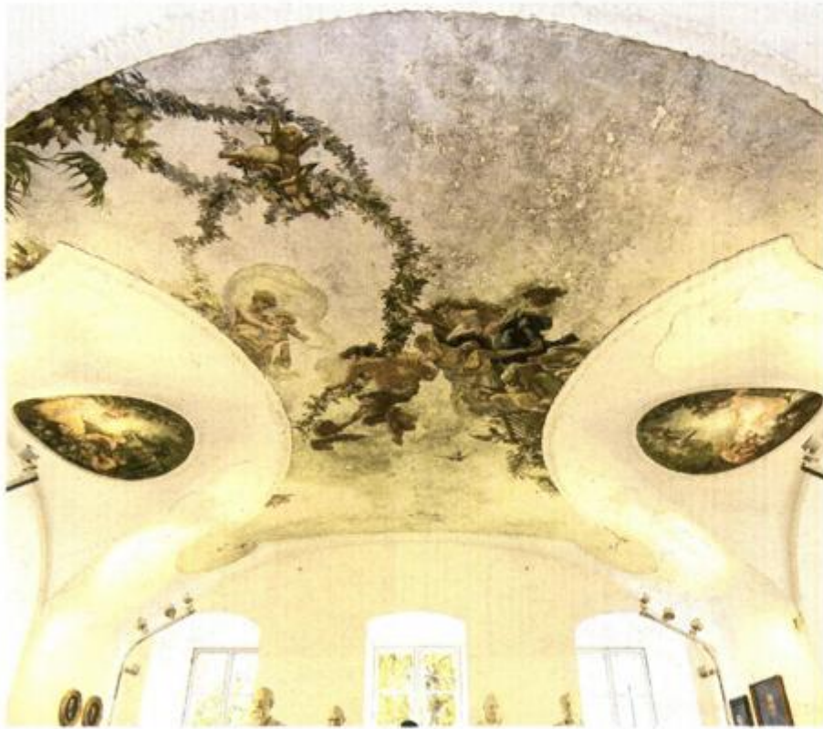
Restaurirane stropne dekoracije

Obnovljeno impozantno zdanje na Brajdi sjedište je prvoga riječkog industrijskog pogona uopće, s interijerom koji govori o bogatstvu, moći i ukusu njenih graditelja