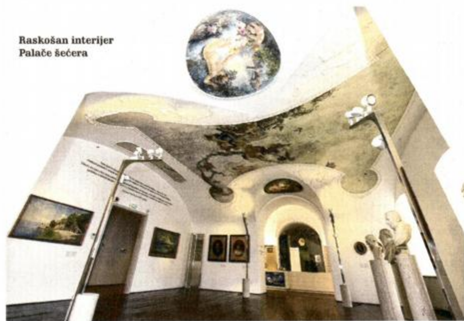
Raskošan interijer Palače šećera