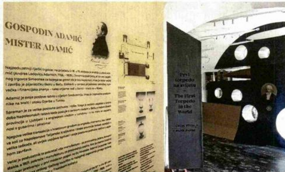
Iz novog postava Muzeja grada Rijeke

Podsjetimo, obnova Palače šećera, prostora u kojem je svoj novi dom pronašao Muzej grada Rijeke u sklopu novoformiranog riječkog kvarta kulture u bivšem »Benčiću«, jedna je od nekoliko velikih obnova zgrada u okviru projekta Rijeku - Europska prijestolnica kulture. Radovi na uređenju Palače šećera započeli su u proljeće 2018. godine i to na ukupno 4.272 metra četvorna njena prostora. U to je veličanstveno zdanje sada smješten Muzej grada Rijeke, koji u svom stalnom izložbenom postavu obrađuje mnoge riječke teme poput prvog torpeda na svijetu, Mornaričke akademije, Rijeke kao iseljeničke luke, povijesti gradskog kazališta, riječkih nebodera, glazbe, riječkog