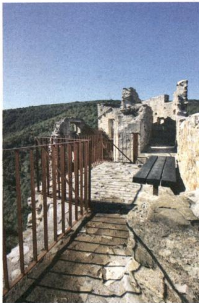
Kaštel obnovljen za nova stoljeća