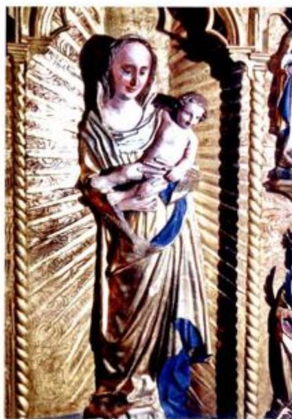
Marijin kip na glavnom oltaru