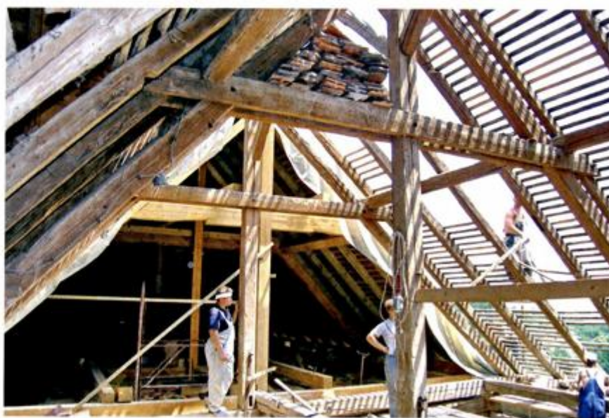
Obnova krovišta 2005.

Takvo je stanje bilo posljedica radova na crkvi nakon potresa 1880. Nakon što su srušena dva kata samostana prislonjena uza sjeverni zid crkve, koja su bila pod produljenim krovom crkve koji je i iznad broda i svetišta imao sljeme u ravnini bez loma, prerađena je konstrukcija u dva volumena. Na južnom dijelu krovišta s visuljama ostao je sustav iz 18. stoljeća, oslonjen na nazidnice povezane s protugredama, kuscima, a sjeverni dio, manjeg raspona od srednjeg stupa zbog skraćanja plohe, bio je drugačiji i novije sheme. Prilikom obnove crkve nakon potresa 1880., Bollé je propustio krovište napraviti stabilno. U literaturi je analiziran njegov projektantski