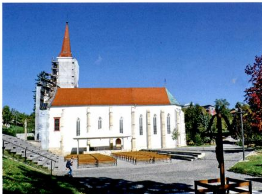
Crkva s južne strane 2020.