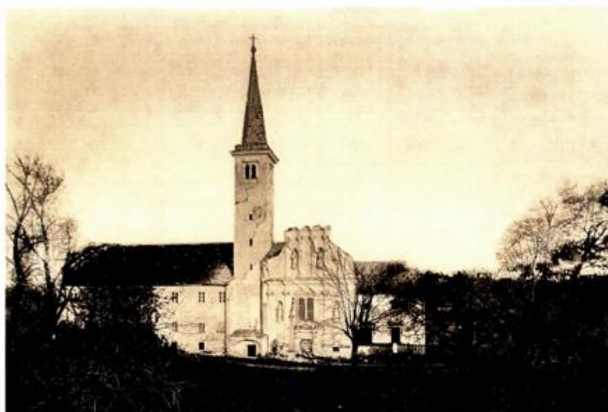
Crkva i samostan nakon potresa 1880., pročelje