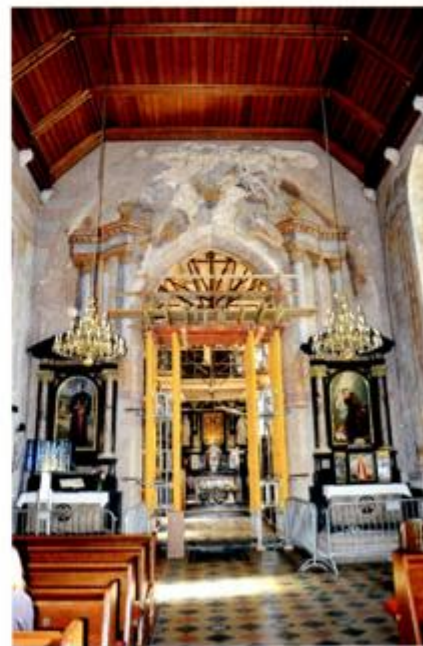
Interijer crkve nakon potresa 2020.