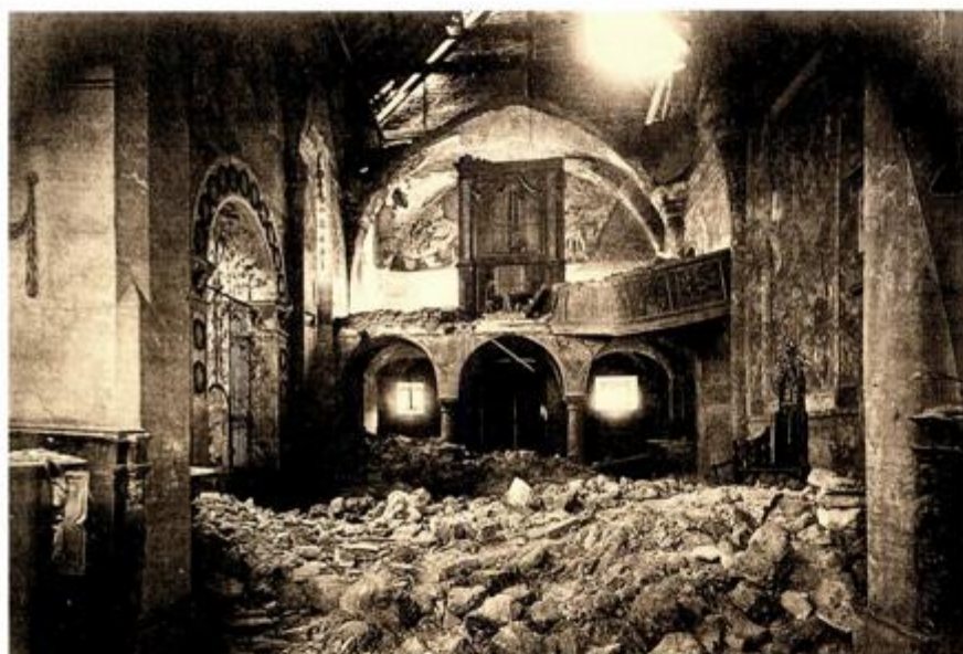
Crkva i samostan nakon potresa 1880., interijer