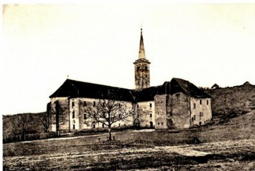
Samostan i crkva nakon potresa 1880. sjeverna strana

višegodišnji rad restauratora, od 1973. do 1978., a nastavljen je 1984., kad je ocijenjeno „da je maksimalno zadržan karakter Rangerovog slikarstva te uspostavljena ravnoteža s prethodno obavljenim radovima na svodu svetišta“.