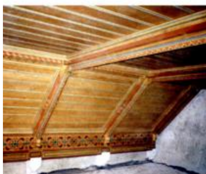
Obnova tabulata 2006.