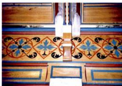
Obnova tabulata 2006., detalj