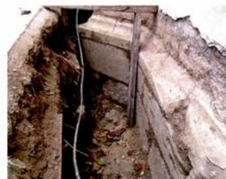
Podnožje i temelji 2008.

rad s povijesno-umjetničkoga gledišta, ali ne i arhitektonskog i tehničkog! lako se zbog takvog stanja krovišta smatralo da bi ga trebalo ukloniti i sagraditi novo, ipak je odlučeno da se zamijene samo oštećeni dijelovi i napravi sanacija i ukrute dodatnim učvršćenjima za stabilizaciju. Radovi su započeli 2003. zamjenom lima nad svetištem (iako je odobren pokrov crijepom, prema izvornom stanju dokumentiranom na Standlovoj fotografiji) i dovršeni 2005.