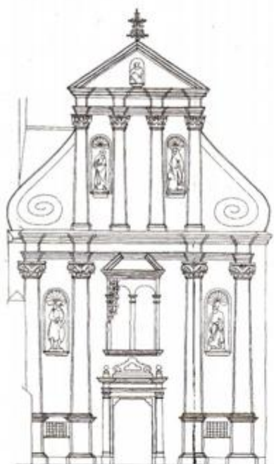
Projekt obnove pročelja prema stanju 1722.

loše stanje drvenog kipa, ugroženog crvotočinom. Kip je restauriran 1996. s ostacima gotičkog okvira.