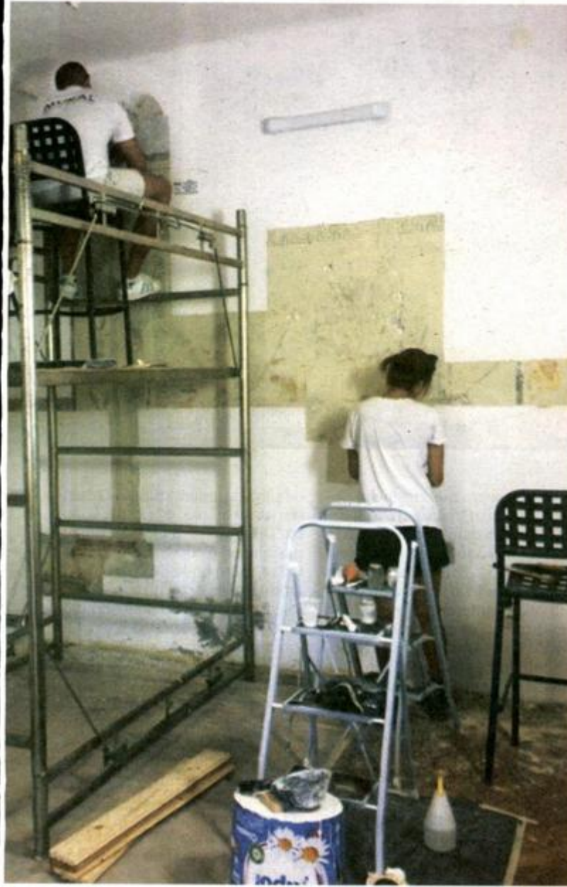
Predani rad konzervatora i restauratora nastavit će se i iduće godine

goistočnoj prostoriji utvrđeno je postojanje više naknadnih slojeva oslika uključujući i izvorni čiji stupanj očuvanosti tek treba utvrditi. Dodatnim sondiranjem stropa središnje prostorije utvrđen je relativno dobro očuvan oslik s dekorativnim geometrijskim i florealnim motivima naslikanima oko centralnog medaljona u kojem se nalazi prikaz svete (vjerojatno sv. Eufemija). Dodatnim sondiranjem zidova jugoistočne prostorije nastavljen je s otkrivanjem tri vedute od kojih je samo jedna