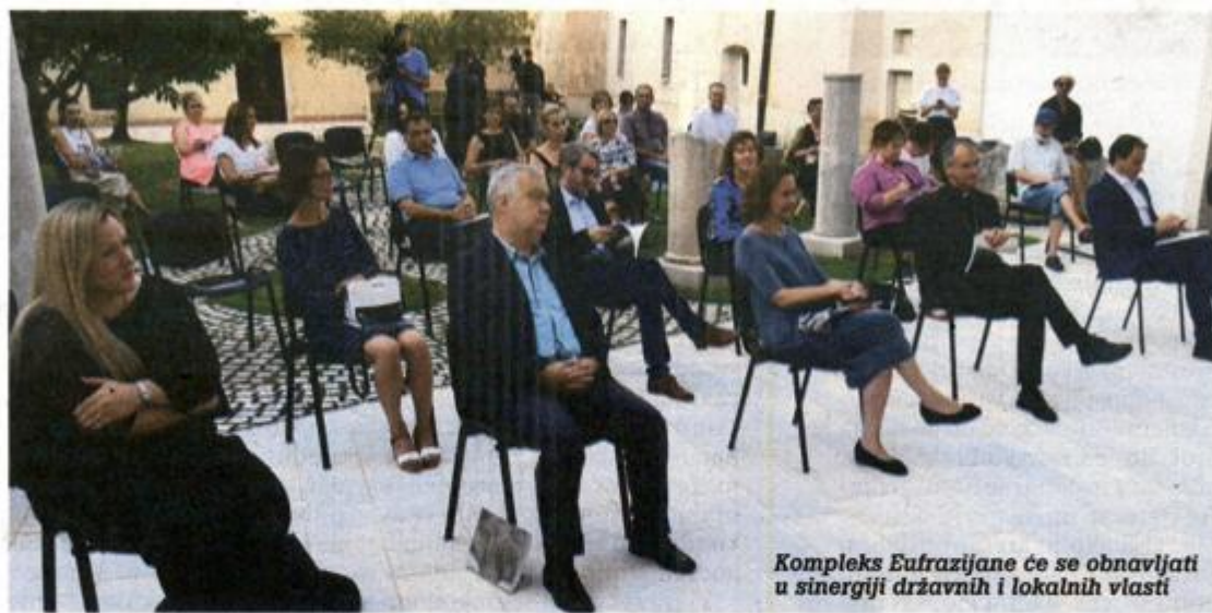
Kompleks Eufrazijane će se obnovljati u sinergiji državnih i lokalnih vlasti

Vrijednost radova, prema okvirnom sporazumu potpisanim početkom prosinca 2019., iznosila je 2,4 milijuna kuna s uključenim PDV-om, rekla je Tajana Pleše, ravnateljica Hrvatskog restauratorskog zavoda.