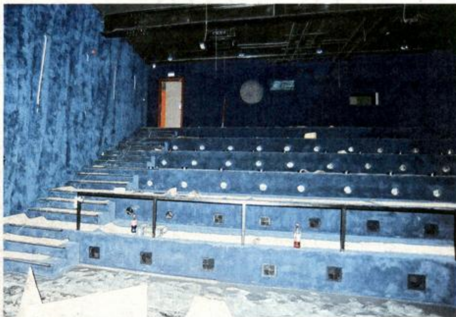
Višenamjenska dvorana sa 75 sjedećih mjesta u Dječjoj kući