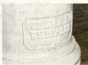
U Dječjoj kući zadržani su originalni stupovi

Ulazni atrij Dječje kuće zamišljen je kao prostran i slobodan dnevni boravak koji će,