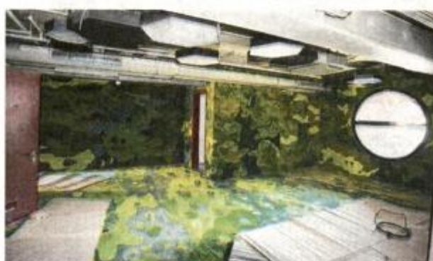
Veselo i razigrano