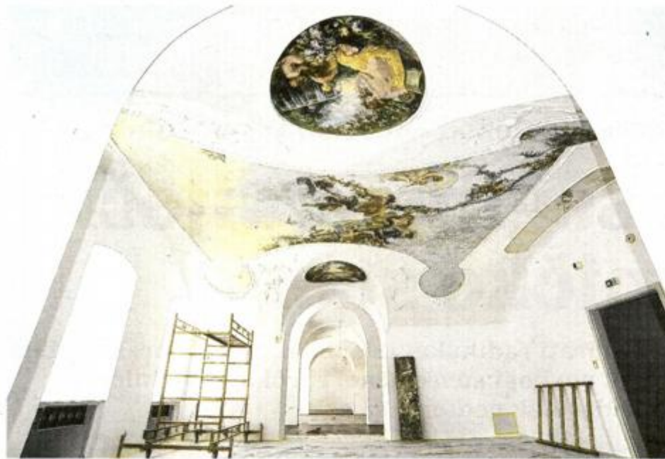
U nekadašnju upravnu zgradu tvornice šećera, tzv. Palaču šećera, preseliti će Muzej grada Rijeke