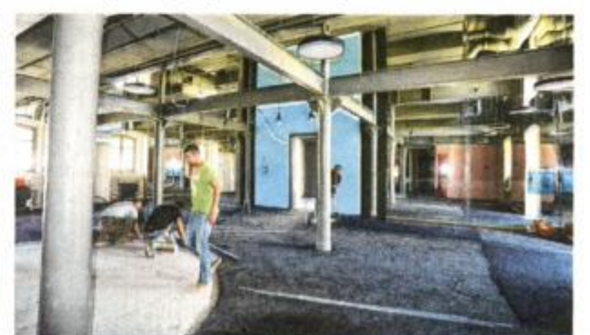
Ulazni atrij Dječje kuće zamišljen je kao dnevni boravak