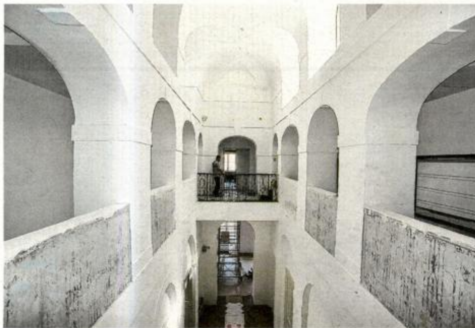
Privlačan izgled unutrašnjosti Palače