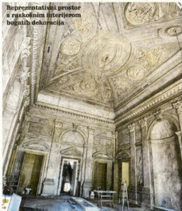
Reprezentativni prostor s raskošnim interijerom bogatih dekoracija

d.o.o. iz Zagreba, također se privode kraju. Ciglana fasada u potpunosti je obnovljena, a pri kraju su i radovi na svim etažama zgrade, uključujući i terasu koja je dijelom natkrivena.