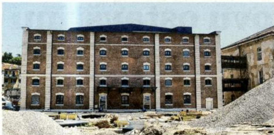
Atraktivna fasada Dječje kuće

“Ciglana zgrada već i izvana izgleda kao prava ljepotica, a unutrašnjost je sva u znaku najmladih, šarena i razigrana, i zaista mislim da će vrlo brzo po otvorenju postati omiljeno okupljalište riječkih mališana i njihovih roditelja