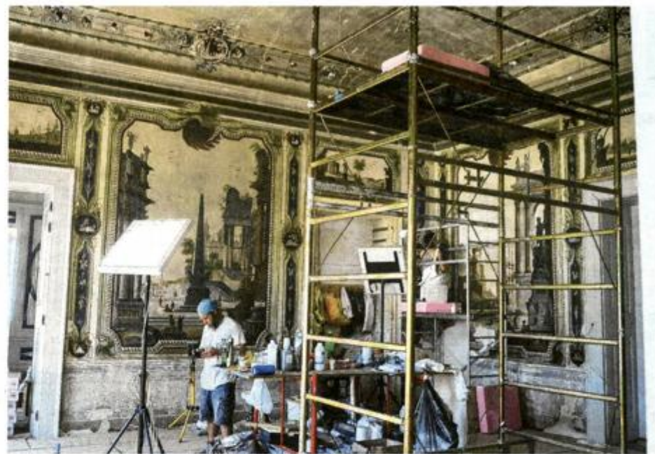
Pri kraju je i obnova originalnih zidnih i stropnih dekoracija