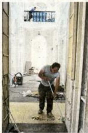
Svi radovi bit će gotovi za 15-ak dana

osim garderobe, sanitarnih prostorija i prolaza do stubišta za gornje katove, ponuditi i izložbenu i interaktivnu cjelinu u kojoj će djeca moći boraviti s roditeljima i zabaviti se bez unaprijed planiranog dolaska ili upisa u pojedinu radionicu. Na prvom, odnosno drugom katu, smještena je s jedne strane višenamjenska dvorana sa 75 sjedećih mjesta, velikim projekcijskim platnom i malom pozornicom, a s druge strane više radioničkih prostora te filmski i glazbeni studio. Na trećem katu Dječje kuće smjestit će se Stribor, odjel gradske knjižnice za djecu, koji će time useliti u dvostruko veću kvadraturu, a s novim prostornim mogućnostima otvorit će i neke posve nove sadržaje za svoje male članove. Povezano s time, u T-objektu, budućoj Gradskoj knjižnici, formirat će se odjel za mlade i na taj će se način primjereno razdijeliti literatura za mlade i ona za djecu. I konačno, na krovu Dječje kuće, u prostoru malog krovnog amfiteatra, događat će se pripovjedno kazalište u kojem glumac pripovijeda priču i povremeno u nju uključuje lutke kao likove.