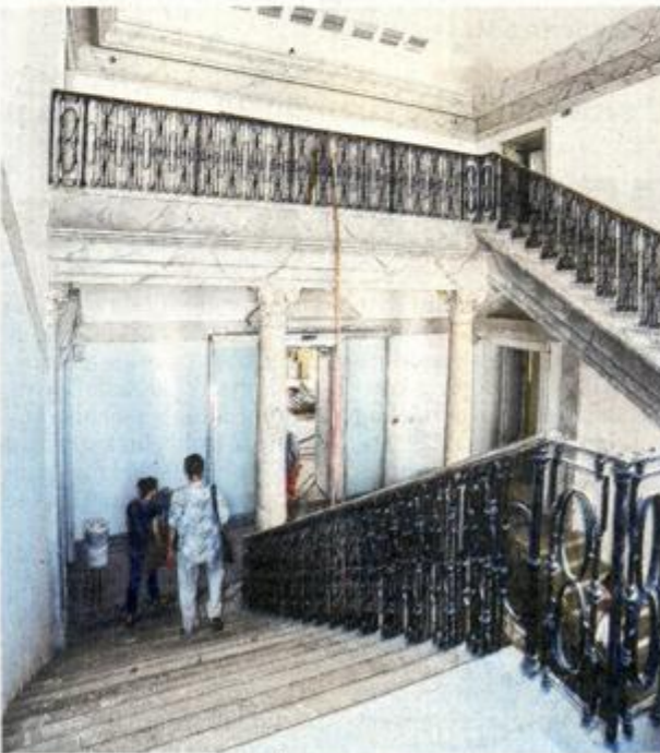
Obnovljeno je i stubište Šećerane

- U međuvremenu ćemo u obnovljenom Exportdrvu otvoriti niz velikih izložbi u sklopu programa EPK, pa smo odlučili da ne guramo sve u razdoblje od dva tjedna. Zato i razmak od mjesec dana, kaže Šarar.