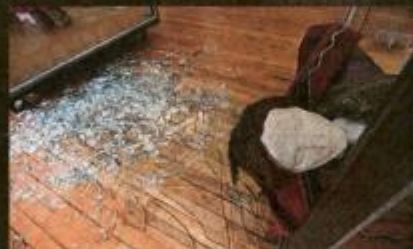
ETNOGRAFSKI MUZEJ Lutke koje su bile u vitrinama popadale su, ali izložci nisu oštećeni, nego samo freske Otona Ivekovića