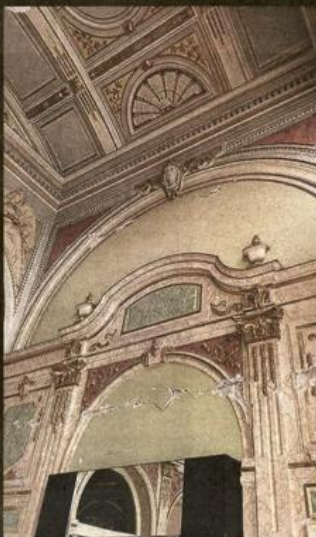
UMJETNIČKI PAVILJON Popucali su pregradni zidovi, no niti jedna umjetnina nije stradala, kao ni stakleni krov