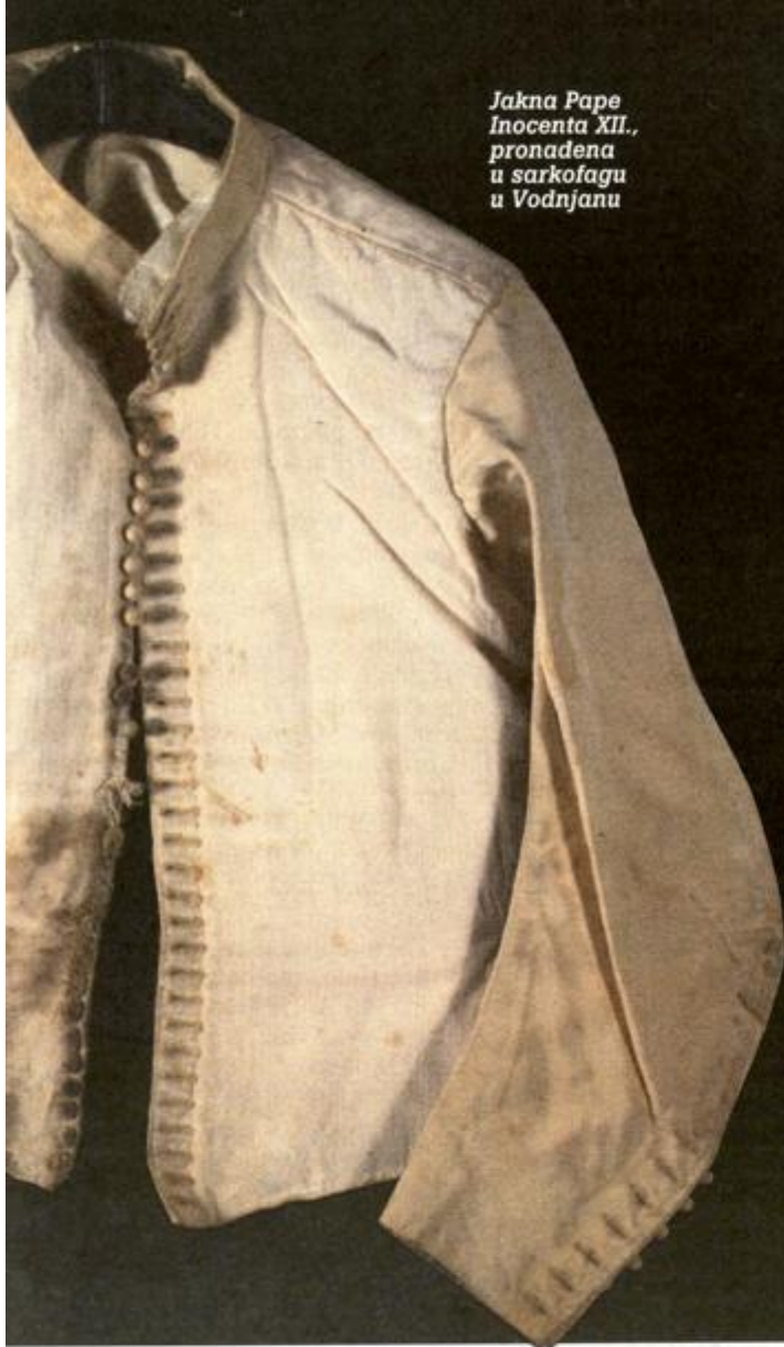
Jakna Pape Inocenta XII., pronađena u sarkofagu u Vodnjaju