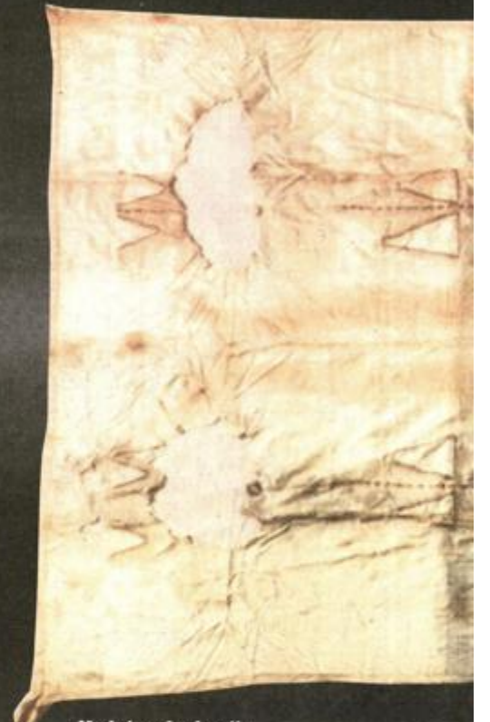
Vodnjanska kopija torinskog platna