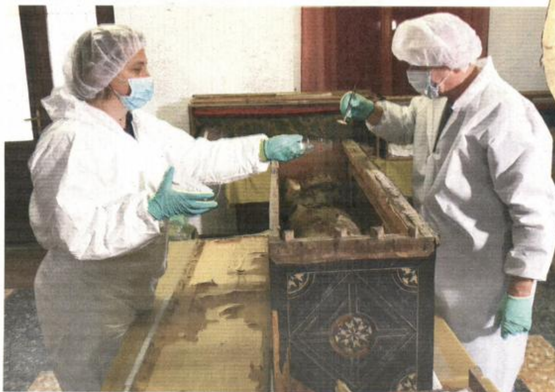
Forenzično istraživanje vodnjanskih mumija

VODNJAN - Prigodom rekognicije i znanstvene obrade relikvija našli smo novine koje imaju veliku važnost i za koje javnost mora znati. Našli smo jednu od pet kopija Torinskog platna kakvim je bilo prekriveno mrtvo tijelo Isusovo. To je otkriveno nakon proučavanja zgužvanog platna koje smo pronašli u sarkofagu svete Kordule u listopadu prošle godine. Čujte, mislili smo ga baciti, a kad smo ga razmotali, svi smo ostali u čudu. Pretpostavlja se da su platno u koje je bilo položeno Isusovo tijelo križari sa Istoka prenijeli na Zapad. Posjedovali su ga savojski grofovi u Camberyu u