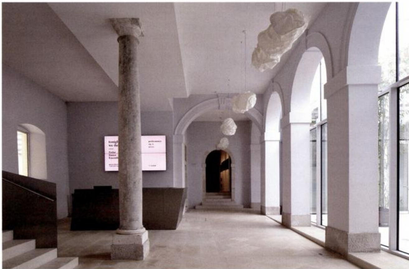
Pretpriprostora s infopultom; Jasenko Rasol, 2016.

sastajališta/okupljališta. Zbog svoje središnje i ulazne orijentacije (povezanost s ophodom u prizemlju, pristup svim glavnim pravcima kretanja kroz objekt) atrij je u funkciji predprostora drugih sadržaja u Kneževoj palači te određuje i prostor za događanja. Događanja u atriju mogu se svesti na nekoliko tipova koji zahtijevaju organizaciju vlastitih prostornih konfiguracija: