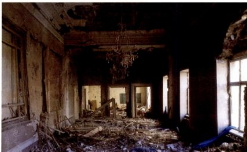
Razaranje Kneževe palače u Domovinskome ratu; Arif Ključanin, 1991.

Kneževa palača u Zadru jest nepokretno (pojedinačno) kulturno dobro upisano u Registar kulturnih dobara pod brojem Z-7106 kao kompleks Namjesništva (bivše Providurove i Kneževe palače). Povijesni izvori bilježe ju još u 13. stoljeću. Zidne strukture pokazuju roma-