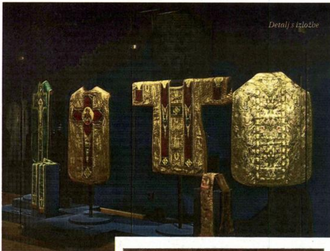
Detalj s izložbe

Izložba predstavlja raskoš od oko 500 obnovljenih i restauriranih predmeta iz zbirki samostanske riznice, knjižnice i arhiva. Riječ je o jedinstvenom i golemom poduhvatu obnove samostanske baštine, koja je od 15. stoljeća sve do danas bila gotovo zastrta od očiju javnosti i koja je u Muzeju za umjetnost i obrt predstavljena u punini njena povijesnog značenja