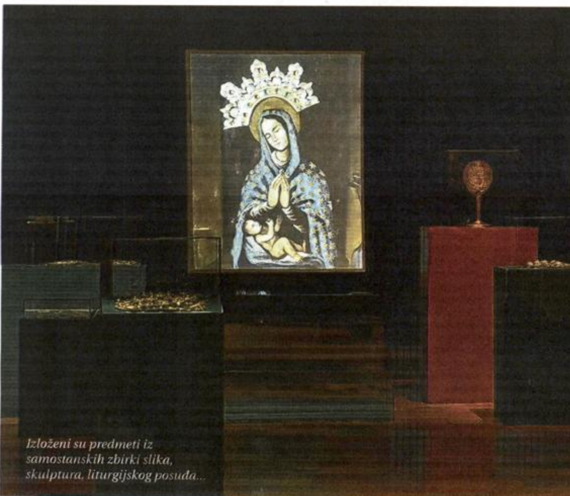
Izloženi su predmeti iz samostanskih zbirki slika, skulptura, liturgijskog posuda...