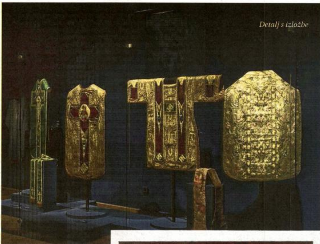
Detalj s izložbe

Izložba predstavlja raskoš od oko 500 obnovljenih i restauriranih predmeta iz zbirke samostanske riznice, knjižnice i arhiva. Riječ je o jedinstvenom i golemom poduhvatu obnove samostanske baštine, koja je od 15. stoljeća sve do danas bila gotovo zastrta od očiju javnosti i koja je u Muzeju za umjetnost i obrt predstavljena u punini njena povijesnog značenja