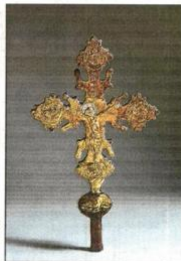
Procesijski križ, domaći majstor, 14. stoljeće