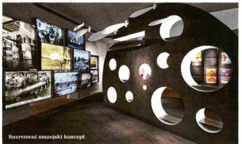
Suvremeni muzejski koncept

30 i više prostorija bit će na dva kata nekadašnje Palače šećera