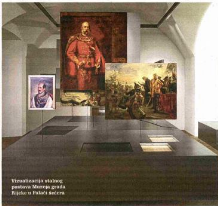
Vizualizacija stalnog postava Muzeja grada Rijeke u Palači šećera