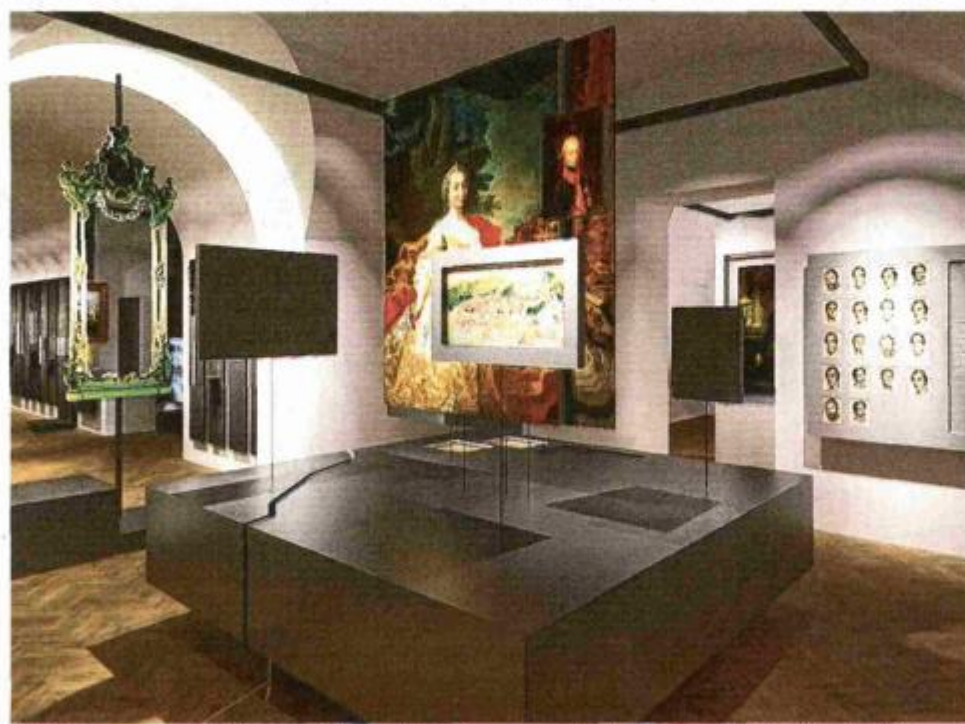
Stalni postav obrađuje gospodarsku i društvenu povijest Rijeke od 18. do 21. stoljeća

Ova monumentalna građevina sagrađena je 1752. godine za potrebe upravne zgrade rafinerije šećera, a sastavni je dio industrijskog kompleksa koji svjedoči o industrijskom razvoju Rijeke u 18. stoljeću. Nakon požara 1785. zgrada je značajno obnovljena i opremljena baroknim interijerima sa zidnim slikama i štukaturom. Život je kompleksu potom donosio nove namjene. Mađarska vojska koristila ga je od 1832. do 1848. kao vojarnicu, a 1851. godine u njemu kreće s radom Tvornica duhana. Izrasla je u najveći pogon za preradu duhana u Austro-Ugarskoj Monarhiji, koji je 1860-ih imao dvije tisuće zaposlenih, a mahom je riječ o radnicima. Kompleks će od 1945. do 1998. godine biti među Riječanima poznat kao Tvornica motora »Rikard Benčić«, zahvaljujući u njemu smještenoj istoimenoj tvornici. U 2020. bit će otvorena kao reprezentativni prostor Muzeja grada Rijeke sa stalnim postavom o riječkoj povijesti i kulturi.