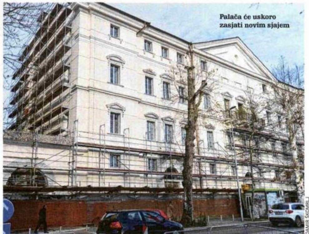
Palača će uskoro zasjati novim sjajem

2019. Konzervatorski odjel Uprave za zaštitu kulturne baštine Ministarstva kulture. Muzej narodne revolucije djelovao je kao ustanova do 1994. godine, kad je odlukom Gradskog vijeća organizacijski preoblikovan u Muzej grada Rijeke. Zgrada je 2002. godine adaptirana zbog potrebe za dodatnim prostorom, a u kolovozu prošle godine krenula je obnova zgrade koja obuhvaća obnovu elektroinstalacija, rasvjete, klimatizacije i sigurnosnog sustava, odnosno protupožarnog sustava, sustava videonadzora, te alarmnog sustava. Ti su zahvati neophodni da bi zgrada postala uređena prema današnjim najstrožim muzejskim standardima. Zahvati moraju biti završeni do otvorenja izložbe »Nepoznati Klimt« u srpnju 2020. godine, a dok se zahvati ne završe, kockica će biti bez postavljenih izložbi.