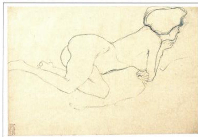
Gustav Klimt, Kupferstichkabinett der Akademie der bildenden Künste Wien

KLIMT JE DIO OPĆE KULTURE U NAJŠIREM SMISLU, IME KOJE, S PICASSOM, VAN GOGHOM, I DRUGIM VELIKANIMA, KOD VEĆINE LJUDI PRIPADA U "PREDODŽBU SLIKARSTVA"