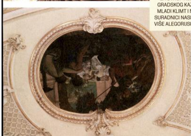
ZA STROP RIJEČKOG GRADSKOG KAZALIŠTA MLADI KLIMT I NJEGOVI SURADNICI NASLIKALI SU VIŠE ALEGORIJSKIH SLIKA