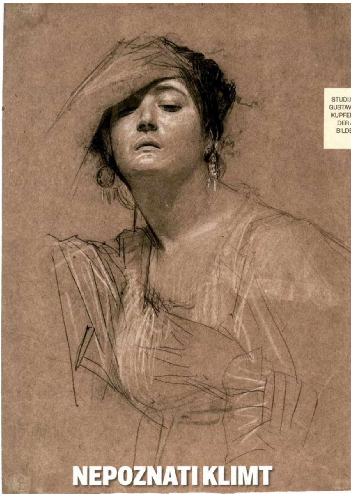
STUDIJA ZA KLEOPATRU, GUSTAV KLIMT, 1884./85., KUPFERSTICHKABINETT DER AKADEMIE DER BILDENDEN KÜNSTE WIEN