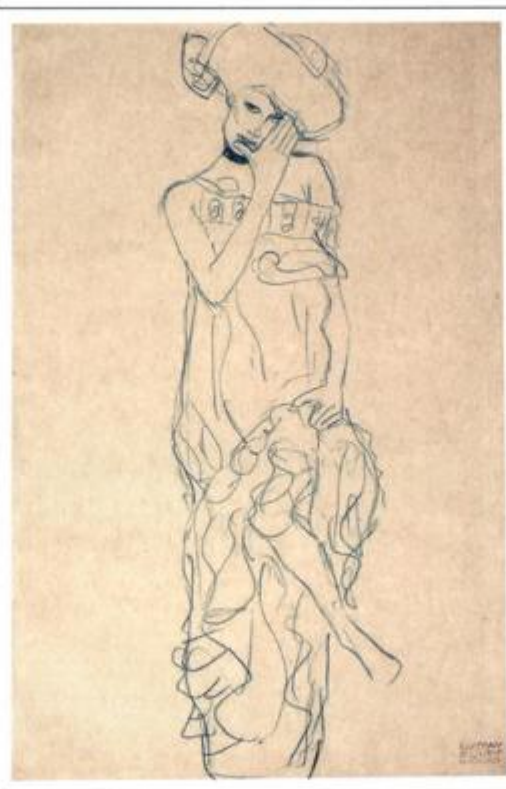
Studija za Juditu II, Gustav Klimt, 1908., Kupferstichkabinett der Akademie der bildenden Künste Wien