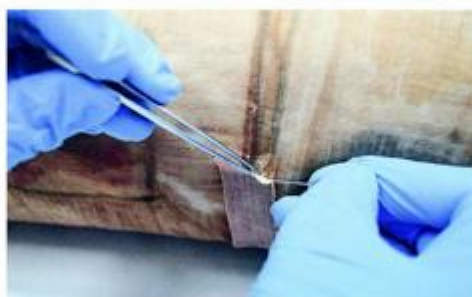
Teška oštećenja na platnu zahtijevala su složene postupke obrade