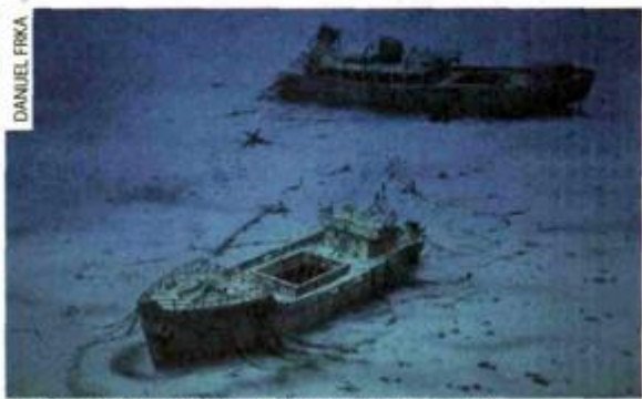
BROD ARGO: POTONUO U JADRANU 1948. GODINE

U RALJAMA MORA: PRIČE O SUKOBU LJUDSKE AMBICIJE I ZASTRAŠUJUĆE SNAGE OCEANA