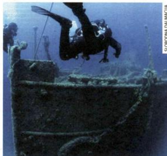
SZENT ISTVAN: OSTACI AUSTROUGARSKOG PONOSA

● Putnici su visoko ocijenili ovaj najmanji naseljeni otok na Havajima za kategorije odmor, plaže i mir, pa je izvršno odredište za putnike koji su u potrazi za odmorom u osami. Na obali otoka nalazi se mnoštvo olupina, a plaža s olupinom Kaiolohia, duga 9.5 km, nalazi se oko 45 minuta automobilom od grada Lanai. Plaža zbog snažnih struja i kamenitog dna mora nije idealna za plivanje. Ipak, brojni putnici i dalje dolaze na plažu kako bi se divili najpopularnijim olupinama na otoku, uključujući brod YOGN-42, tanker iz Drugog svjetskog rata koji leži 200 m od sjeverne obale otoka. Do plaže s olupina