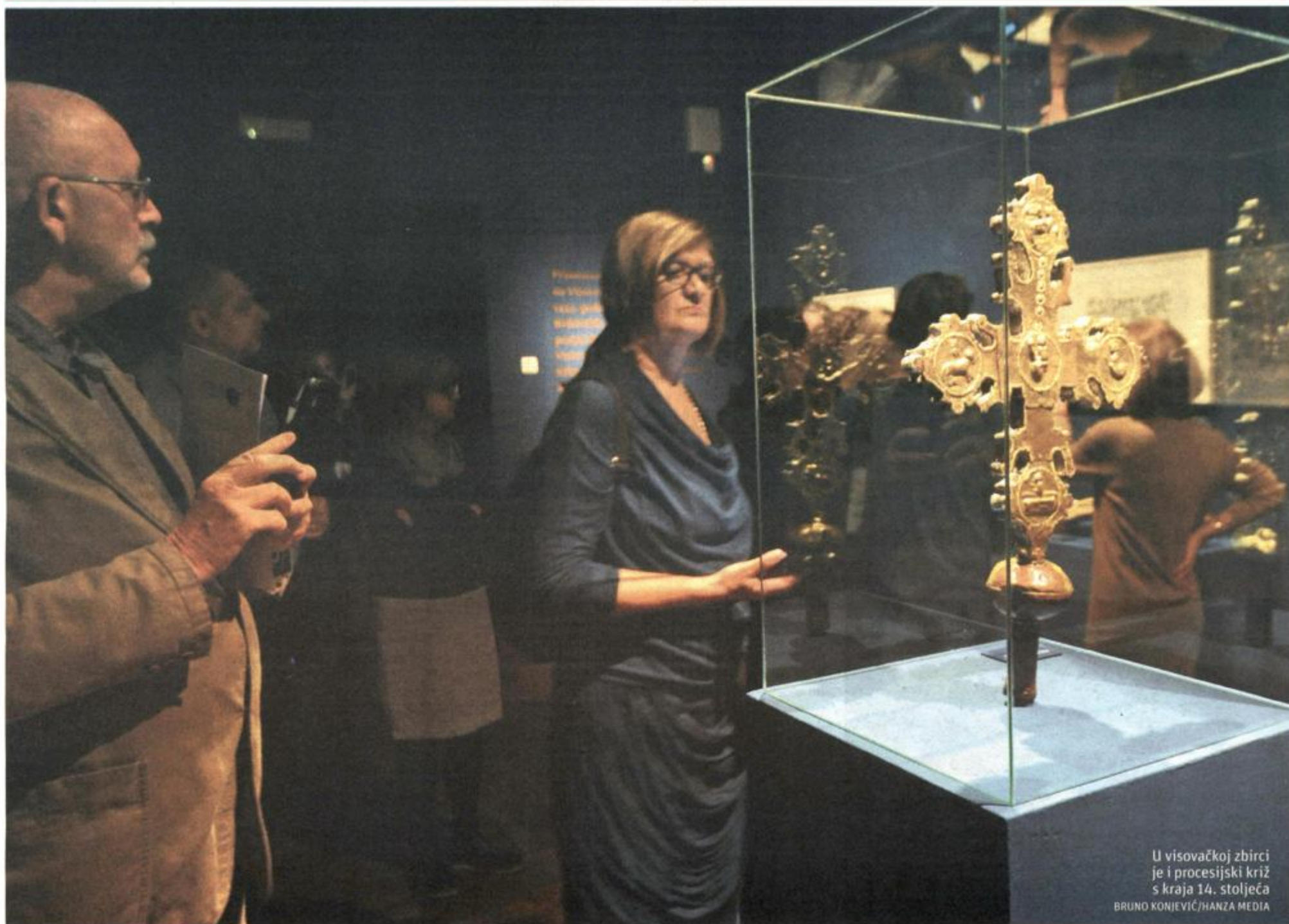
U visovačkoj zbirci je i procesijski križ s kraja 14. stoljeća

PROJEKT GODINE MUZEJA ZA UMJETNOST I OBRT