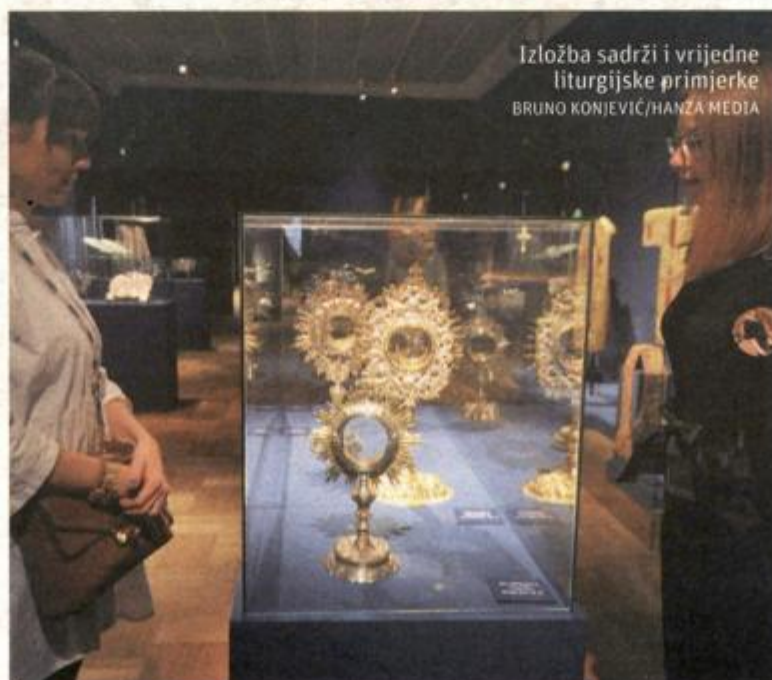
Izložba sadrži i vrijedne liturgijske primjerce