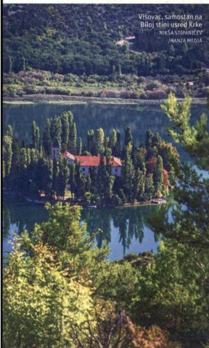
Visovac, samostan na Biljoj stini usred Krke