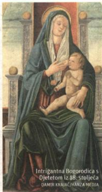
Intrigantna Bogorodica s Djetetom iz 18. stoljeća