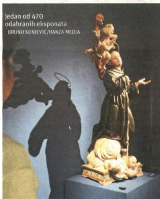
Jedan od 470 odabranih eksponata