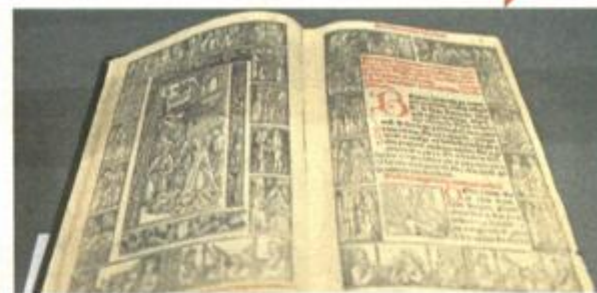
Jedna od vrijednih knjiga iz franjevačke knjižnice