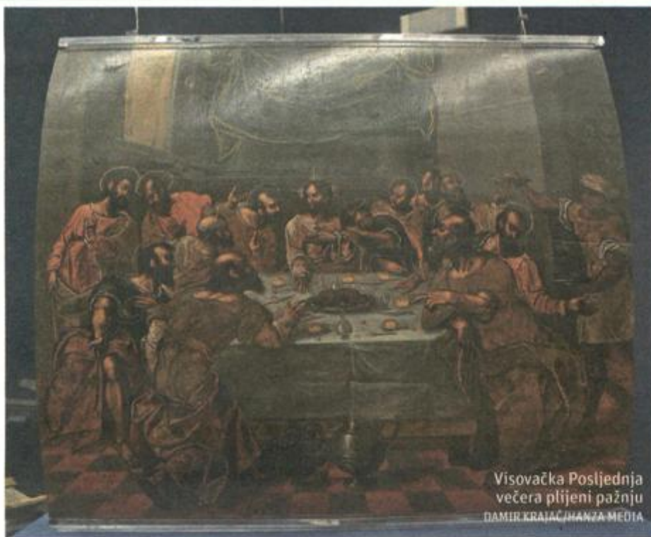
Visovačka Posljednja večera plijeni pažnju