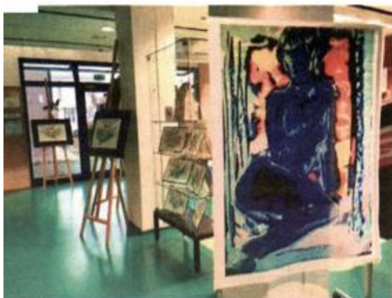
Ozračje izložbe u Karlovcu