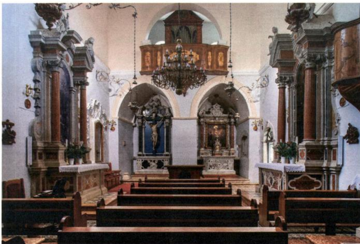
Oltar Gospe Visovačke, 1679., Crkva Gospe Visovačke, Visovac.

kroz sinergiju rada tima kustosa, konzervatora i restauratora iz Muzeja za umjetnost i obrt, restauratora i konzervatora iz Hrvatskog restauratorskog zavoda s područnim odjelima u Splitu, Zadru i Dubrovniku, povjesničara umjetnosti, teologa, znanstvenika s Filozofskog fakulteta u Zagrebu i u Splitu, filologa, arhitekata, muzikologa s Odsjeka za povijest hrvatske glazbe u HAZU, Umjetničke akademije u Splitu i muzejskih stručnjaka - kustosa iz Muzeja za umjetnost i obrt predvođenih ravnateljem MUO - a Miroslavom Gašparovićem.