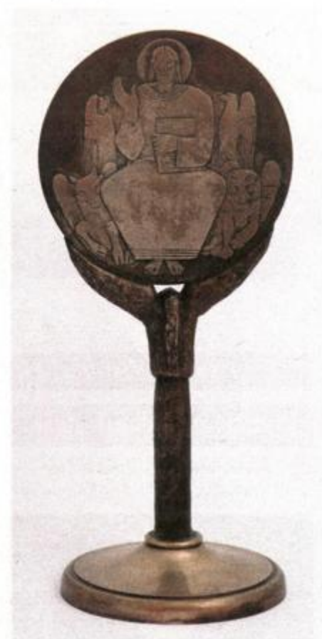
Ivan Meštrović, Monstranca, 1935. - 1939.