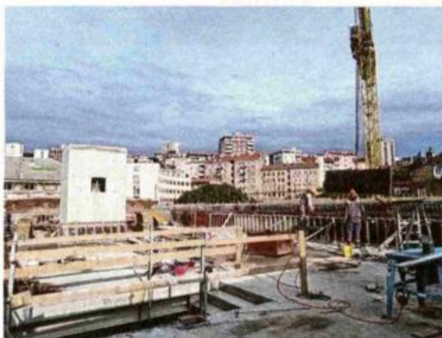
Pogled s krova Ciglene zgrade