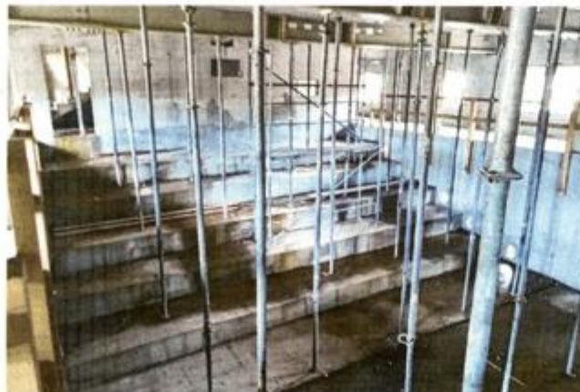
Radovi su u punom jeku

- Na gradilištu Dječje kuće radovi su takve prirode da su velike promjene vidljive iz dana u dan. Od kolovoza do danas unutar stare ciglene opne izrasla je potpuno nova zgrada. Prolaznici mogu i sami vidjeti da je »kućica lifta« izvirila iznad vrha zgrade, sva četiri kata su gotova i ovih se dana u potpunosti dovršava završna betonska krovna ploča, što znači da je kuća pod krovom. Ona velika rešetka skela koja je bila mjera