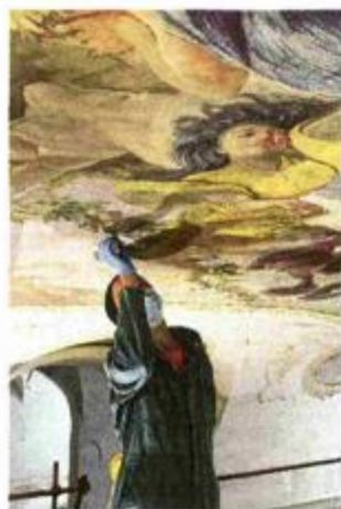
Radovi na restauraciji freski