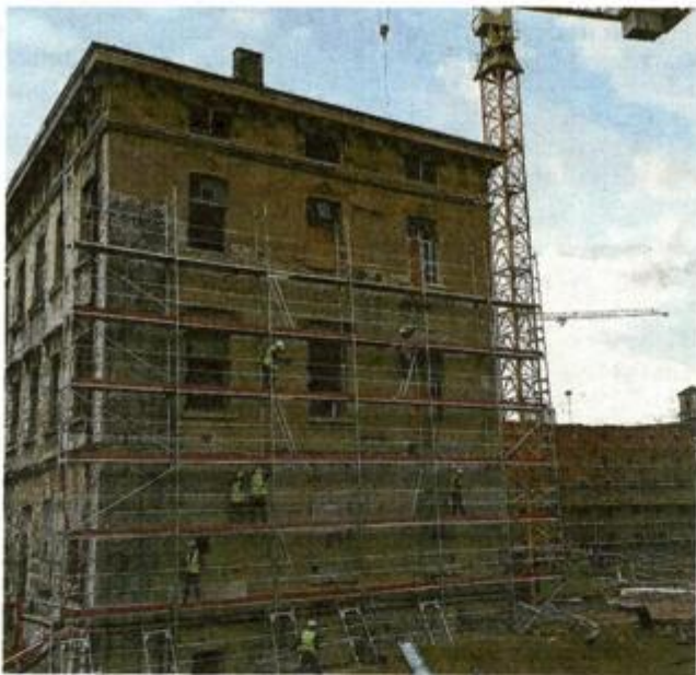
T-objekt - buduća Gradska knjižnica Rijeka

predostrožnosti da se ciglena opna ne uruši, skinuta je, kaže Ivan Šarar dodajući kako je počela priprema za ugradnju vanjske stolarije, a postavlja se i nova skela koja služi za završne radove na prepoznatljivoj ciglenoj fasadi.