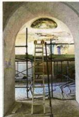
Unutrašnjost Palače šećera već sad izgleda impresivno