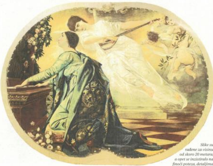
Slike su radene za visinu od skoro 20 metara, a opet se inzistiralo na finoći poteza, detaljima

- Prije bih rekla da je to kompliment, jer svi smo se mi dovoljno dugo školovali i imamo puno radnog iskustva, uskladili smo način rada s kolegama iz Zagreba, a posjedujemo i dosta dobre uvjete za obavljanje tog posla – kaže Rušin-Bulić.