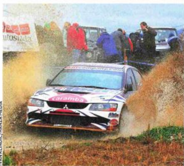
IVAN KLINDIĆ/HANZA MEDIA