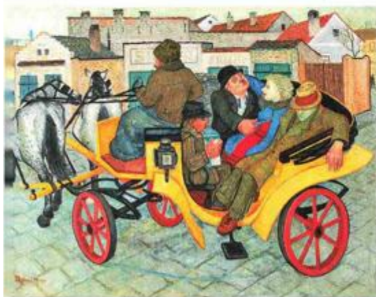
Marijan Detoni, "Pijana kočija", 1935., Muzej savremene umetnosti, Beograd, inv.br. 1429