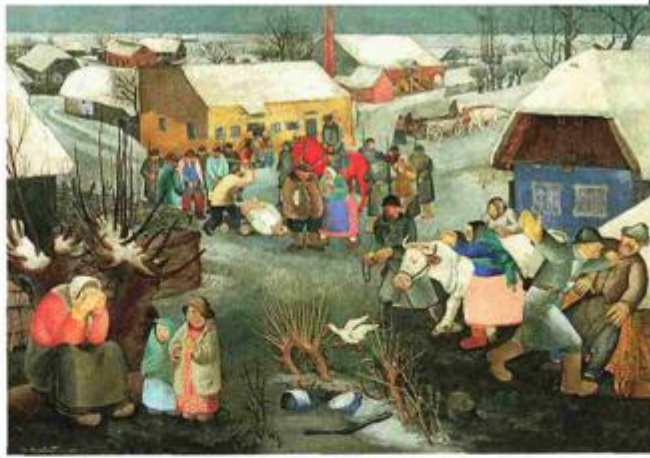
Krstó Hegedušić, "Rekvizicija", 1929, Muzej moderne i suvremene umjetnosti Rijeka, MMSU RI-145