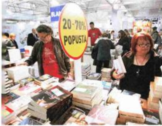
TOMISLAV KRISTO/HANZA MEDIA