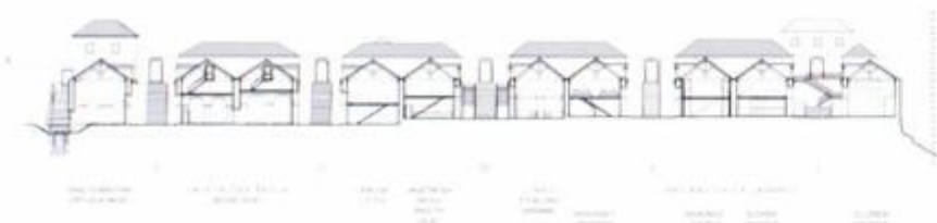
Poprečni presjek povijesnog kompleksa Lazareta

domaći ljudi, ni stranci koji stižu iz kužnih krajeva ne mogu ući u grad ako prethodno ne borave 30 dana na otocima Mrkanu, Bobari i Supetru pored Cavtata. Zbog udaljenosti, ali i iz strateških razloga, karantena je premještena bliže Dubrovniku, a početkom 15. stoljeća izgrađen je lazaret na Dančama. Dobra organizacija toga lazareta omogućila je potpuno ukidanje karantene na otocima pokraj Cavtata. Zbog velikoga porasta opsega dubrovačke trgovine u 16. stoljeću kapacitet lazareta na Dančama postao je premalen, pa je dubrovačka vlada 1534. odlučila sagraditi veću karantensku građevinu na otoku Lokrumu, koja iz strateških razloga nikada nije dovršena. Nakon toga problem karantene još dugo nije bio riješen. Krajem 16. stoljeća razmišljalo se o izgradnji lazareta na Pločama, no radovi na provedbi toga projekta započeli su tek 1627. i trajali do 1647. godine. Sklop Lazareta sastojao se od pet istovjetno organiziranih odjela, među kojima su tri istočna nešto duža