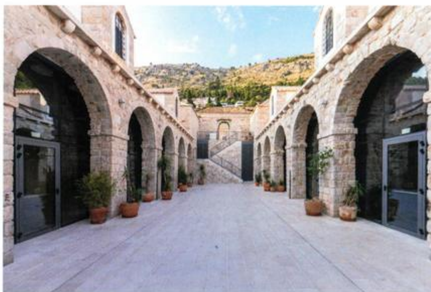
Pogled na dvorište između dva lazareta

Karantena (lazareti) u starome Dubrovniku bila je ponajprije institucija, a ne građevina, premda je sklop zgrada na Pločama danas postao njezin sinonim. Lazareti su bili u nadležnosti Zdravstvenoga magistrata sastavljenog od petorice vlastelina (tal. Officiali alla Sanità ) koji su propisivali praktične mjere protiv širenja zaraznih bolesti. Upravljanje Lazaretima bilo je povjereno kapetanu Lazareta i njegovu zamjeniku, koji su za trajanja mandata ondje morali stanovati zajedno s pomoćnim osobljem. S obzirom na iznimnu gospodarsku i stratešku važnost Lazareta za Dubrovnik, sklop je tijekom Dubrovačke Republike bio dobro i redovito održavan državnim sredstvima, a posljednji veći građevinski zahvat na njemu izveden je 1784. Lazareti su, uz kratkotrajni prekid tijekom francuske okupacije, zadržali funkciju i za austrijske vlasti, a prema arhivskim spisima, čini se da su ukinuti oko 1872. godine.