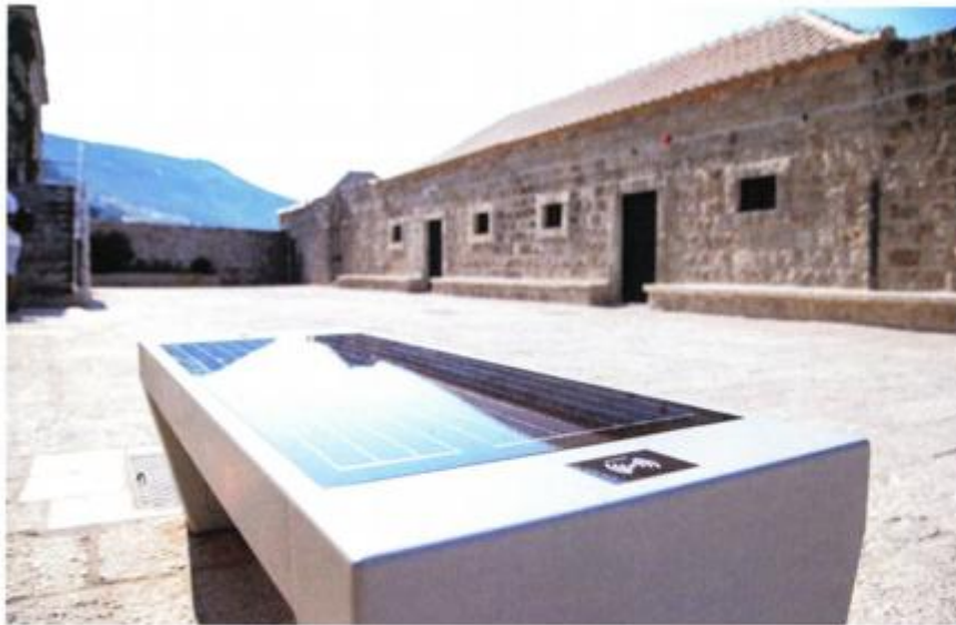
U sklopu projekta instalirane su i tzv. pametne klupe