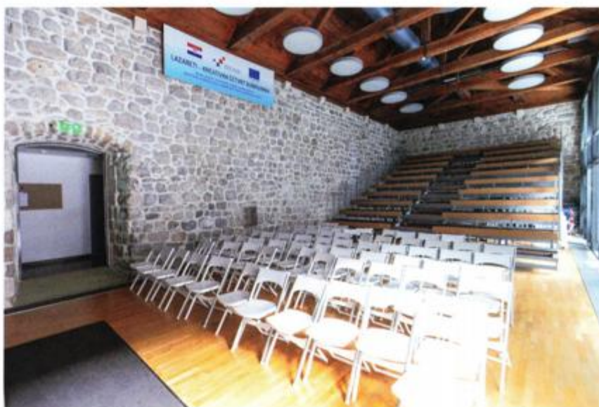
Pogled na obnovljeni amfiteatar

U sklopu završne konferencije projekta "Lazareti – kreativna četvrt Dubrovnika", održanoj 28. srpnja 2019., bilo je organizirano svečano otvorenje obnovljenoga povijesnog kompleksa. Na svečanosti su bili Andrej Plenković, predsjednik Vlade RH, Nina Obuljen-Koržinek, ministrica kulture, i Marko Pavić, ministar regionalnoga razvoja i fondova Europske unije. Predsjednik Vlade Plenković tom je prilikom istaknuo to kako će obnovljeni Lazareti upotpuniti kreativni dio ukupne bogate kulturne ponude Dubrovnika, ali i dati novu dimenziju brojnim udrugama koje djeluju u izvrsno opremljenim prostorima. Izrazio je zadovoljstvo time