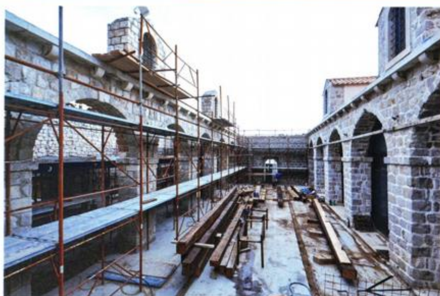
Pogled na gradilište

Dubrovnik želi postati prepoznatljivo kulturno-povijesno odredište tijekom cijele godine, čime bi se trebali stvoriti temelji za provedbu integriranoga razvojnog programa cijeloga turističkoga odredišta. Projekt je osmišljen kroz jedanaest kom-