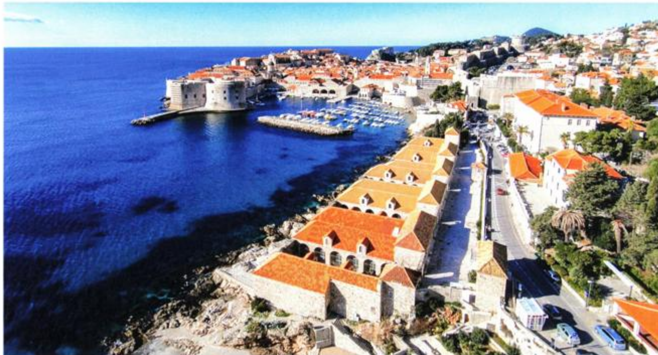
Pogled na Lazarete i stragu gradsku jezgru Dubrovnika

Kako bi se spriječio prijenos smrtonosne bolesti, upravo je u Dubrovniku donesena prva odluka o utemeljenju karantene u povijesti europskoga zdravstva. Lazareti su izgrađeni kao jedna od preventivnih zdravstvenih mjera zaštite stanovnika u Dubrovačkoj Republici. Budući da je ta važna luka primala putnike iz svih krajeva svijeta, Veliko vijeće Dubrovačke Republike je 27. srpnja 1377. donijelo odluku kojom je prvi put u svijetu uvedena karantena kao mjera zaštite od unošenja i širenja zaraznih bolesti, ponajprije kuge. Ta je odluka objavljena u tzv. Zelenoj knjizi pod naslovom "Tko dolazi iz okuženih krajeva, neka ne stupi u Dubrovnik ni na njegovo područje" (prevedeno s latinskoga jezika). U odluci je propisano to da ni