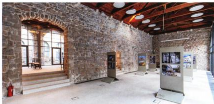
Pogled na izložbeni prostor u Lazaretima

kulturne ponude Dubrovnika namijenjene građanima i posjetiteljima. Projekt je prilagođen potrebama svih ljudi, o vođenju osoba s invaliditetom educirani su i turistički vodiči, a dovršena je i izrada maketa Lazareta koja će slijepim osobama omogućiti da dožive kulturnu baštinu. Projektni je tim educiran o upravljanju kulturnim dobrima, što će omogućiti kvalitetno upravljanje te financijsku i sadržajnu održivost projekta.