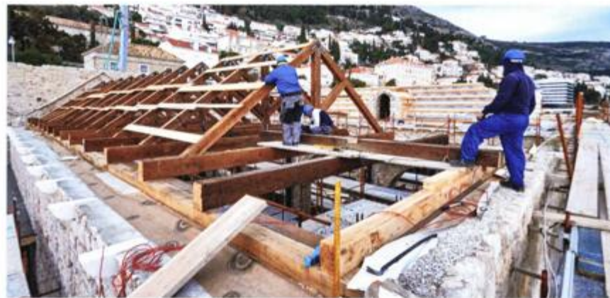
Obnova posljednje tri lađe Lazareta