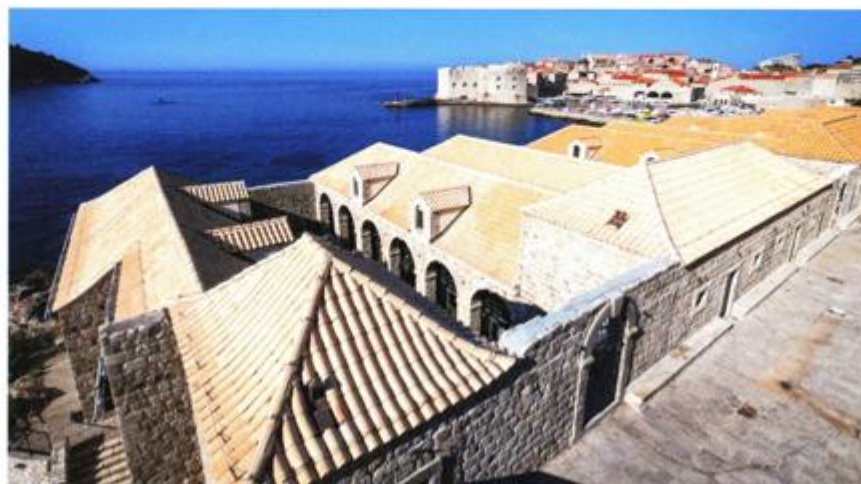
Pogled na Dubrovačke Lazarete