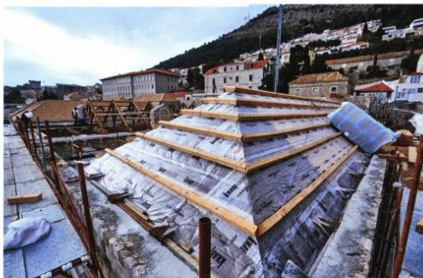
Postavljanje toplinske izolacije

što je projekt sufinanciran sredstvima Europske unije. Povlačenje europskih sredstava bio je neophodan korak za Dubrovnik jer EU daje dodatnu vrijednost obnovi i promidžbi kulturne baštine. Ministrica Obuljen-Koržinek istaknula je to kako Dubrovnik potvrđuje to da Grad uz pomoć Vlade ima snagu obnoviti takve reprezentativne baštinske prostore i staviti ih u funkciju ponajprije svojih građana te to kako su udruge koje će se smjestiti u Lazaretima ključne za kulturni život grada tijekom cijele godine.