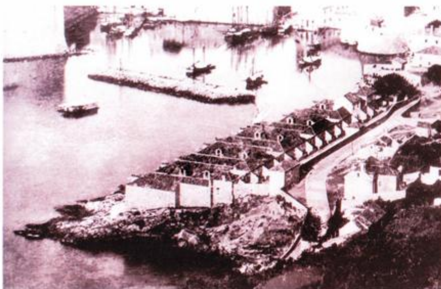
Karantenski sklop lazareta u 17. stoljeću