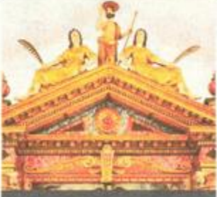
Atika glavnog oltara prije i nakon izvedenih zahvata

Prezentacija učinaka višegodišnjeg konzervatorsko-restauratorskog obnavljanja središnjeg dijela glavnog oltarnog sklopa, nimalo jednostavnih i nezahvatljivih radova, bila je prigoda i da se lokalna javnost upozna sa svime što se posljednjih godina činilo na zaštitu i vraćanju ljepote i sjaja tog iznimno vrijednog kulturnog dobra na kojemu su angažirani restauratorski stručnjaci, etapno, počeli raditi još 2012. godine.