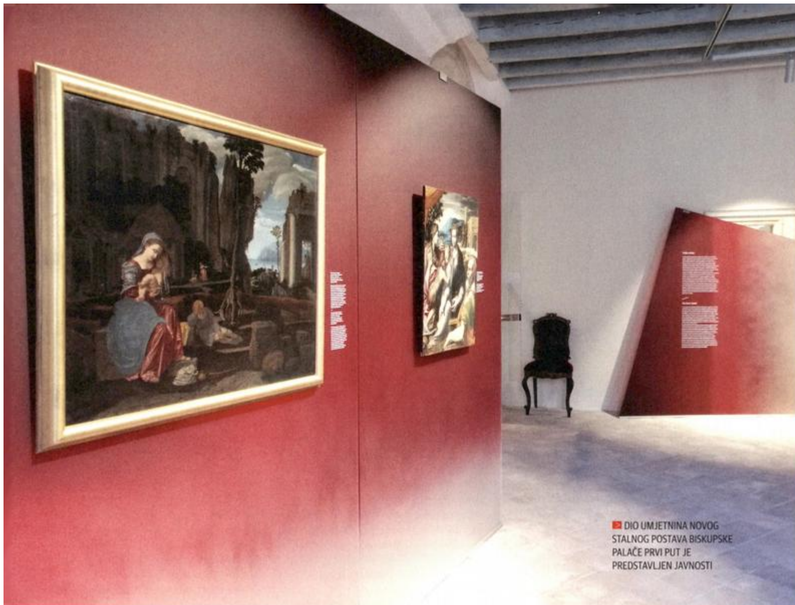
■ DIO UMJETNINA NOVOG STALNOG POSTAVA BISKUPSKE PALAČE PRVI PUT JE PREDSTAVLJEN JAVNOSTI