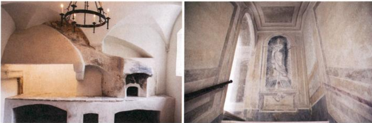
OBNOVLJENI SU I BAROKNA KUHINJA I FRESKE U STUBIŠTU BISKUPSKJE PALAČE

"Na prošlogodišnjoj svečanosti dovršetka radova biskup Mate Uzinić rekao je da se vraća jer već godinama osluškuje što mu govori narod ovog grada i pita ga kad će se Palača vratiti u Grad. On je tada izjavio: 'Nije važna palača, već je Grad u središtu.' Činjenica da dubrovački biskup živi u palači, a zapravo živi u središtu grada, uz svoju katedralu, predstavlja zaista vrijednu situaciju koja je više od geste. Svakodnevnica stanara, biskupa i ostalih ukućana na određeni način animira postav obnovljenog arhitektonskog spomenika, dajući mu autentičnost i životnost kakvu većina drugih sličnih postava iz realnih okolnosti nema niti može imati. Zato treba naglasiti da ovo nije muzej, već je ovo barokna palača koja je u jednome svome dijelu otvorena za javnost. Takvih slučajeva ponegdje ima i među dvorcima i palačama po Europi; u nekima od njih posjetitelji mogu razgledati dio neke povijesne građevine ili neku umjetničku zbirku smještenu u jednome dijelu objekta, dok u drugome dijelu živi vlasnik", zaključio je Ivan Viden.