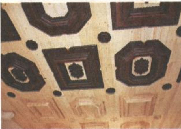
Kasnorenesansni strop u svečanoj gradonačelnikovoj sobi

naroda od 4. st. I Hvar je bio jedna od luka, Hvarani su tada počeli snažno trgovati. Našli smo u Arsenalu arheološki materijal iz sjeverne Afrike, Mediterana, Sirije, Libanona, Turske, to je odraz te veze, pomorske plovidbe i snažne trgovine koja se razvijala. Ulomci keramike i stakla, tisuće amfora, sjevernoafričkih tanjura, materijal koji nam je otvorio tu sliku raširenosti trgovačke aktivnosti oko hvarske luke. Praktički, nije se puno znalo o povijesti grada Hvara prije početka arheoloških istraživanja 1994., istraživanje ga je utemeljilo 500 do 600 godina ranije nego se mislilo da je star, dakle u 4. stoljeće. Približili smo se i imenu Lisina za koje smo mislili da je na Visu. Istraživanje je nadmašilo očekivanja, definitivno. No, najbolja stvar oko Arsenalu je da se objekt konačno završio. Promijenilo se pet ministara kulture i najljepše je da se konačno priča završila!