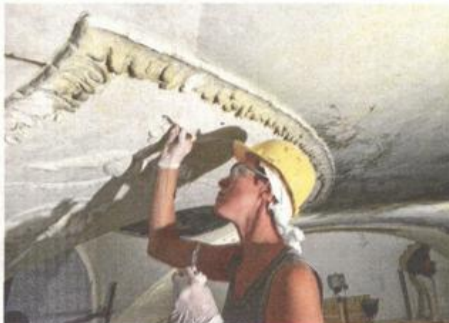
Brine se o svakom detalju, uređuju se stropne freske

- Na Palači šećerane trenutno se izvode krovopokrivački, limarski, tesarski radovi na sjeveroistočnom dijelu krova, fasaderski radovi obijanja stare žbuke na zapadnom pročelju objekta, sanacija kamena na južnom pročelju, zidarski radovi žbukanja zidova, montaže protupožarnih ploča te instalaterski radovi izrade instalacija grijanja i hlađenja, vodovoda i kanalizacije,