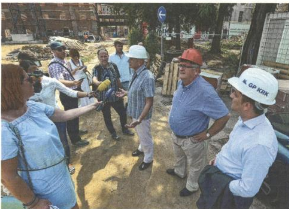
Predstavnici Grada Rijeke provjerili su jučer kako teku radovi u kompleksu »Benčić«

sprinkler instalacija i elektroinstalaterski radovi. Uz građevinske radove izvode se i restauratorski radovi koje obavlja Hrvatski restauratorski zavod. Riječ je o restauraciji zidnih i stropnih oslika te o restauratorskim radovima na kamenu, a završena je sanacija štuko stropova u velikoj dvorani. Predstoji izvođenje podopolagačkih radova, postava preostalih čeličnih greda međukatnih konstrukcija, obrada prodora za instalacije, izvođenje radova razvoda instalacija, sprinkler bazen, ličilački radovi pročelja i unutrašnjosti, ugradnja dizala