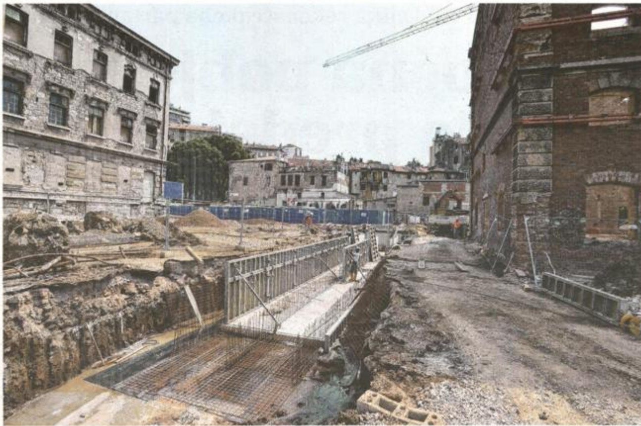
Izvođač radova mora se pobrinuti i za odvodnju

ROKOVI ĆE SE POŠTOVATI Gradonačelnik Rijeke sa suradnicima