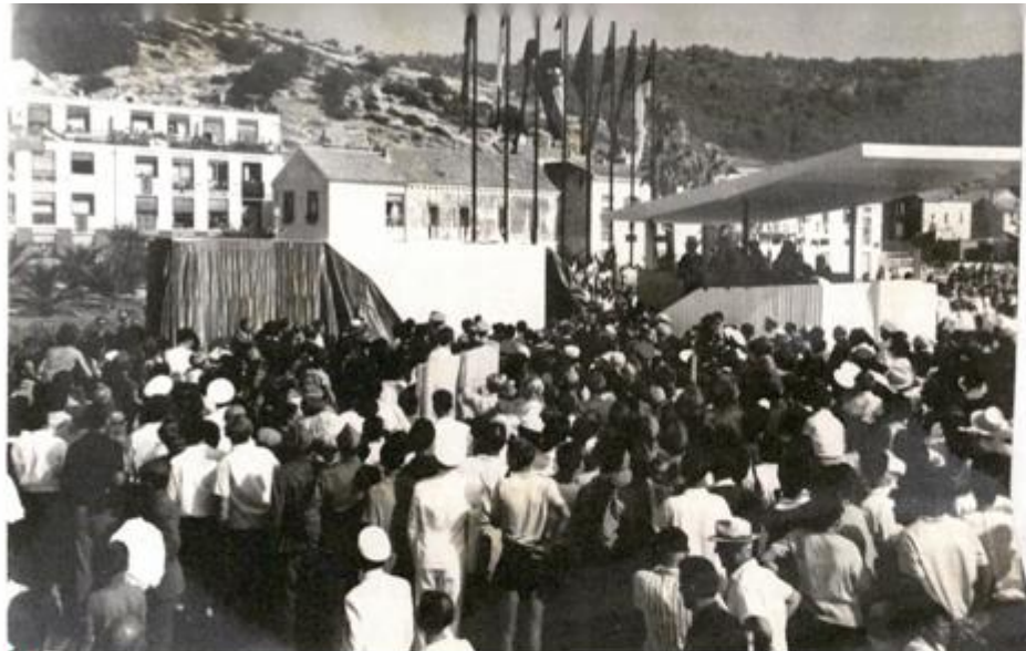
OTKRIVANJE SPOMENIKA 'TUDE NEĆEMO SVOJE NE DAMO' NEVENA ŠEGVIĆA 1964. NA VISU

tekst koji vodi do normalizacije fašizma. Stoga nije čudno da su unuci antifašističkih boraca poskidali veliki dio antifašističkih spomen-ploča i skulptura.