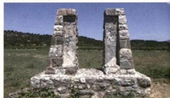
SPOMENIK AVIJATIČARIMA NA VIŠKOM AERODROMU