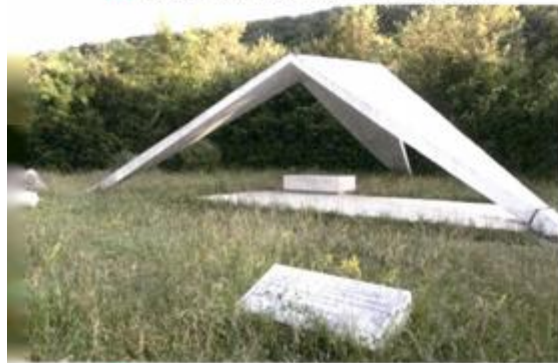
RADUŠA, SPOMENIK 1. SPLITSKOM PATIZANSKOM ODREDU, VUKO BOMBARDELLI, 1962.

NACIONAL: Kako je moguće da je Ministarstvo kulture sve ove godine šutke promatralo uništavanje tisuća spomenika hrvatske spomeničke baštine?