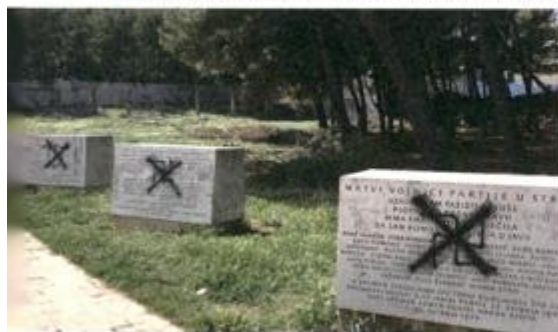
SPOMEN-PARK ŠUBIČEVAC, PARK STRIJELJANIH