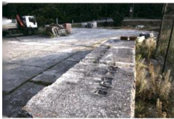
VIS-IZMJESTENI IZREZANI SPOMENIK 'TUDE NEĆEMO...'