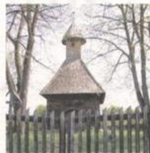
STARA DRENČINA: KAPELA SV. IVANA KRSTITELJA