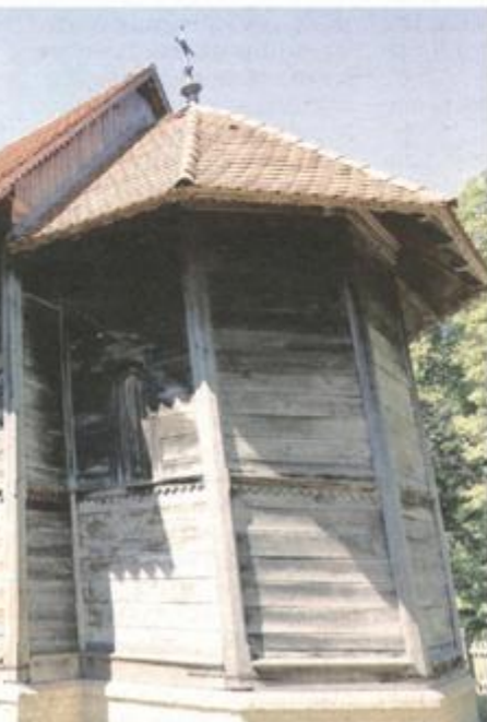
GUSTELNICA: KAPELA SV. ANTUNA PADOVANSKOG