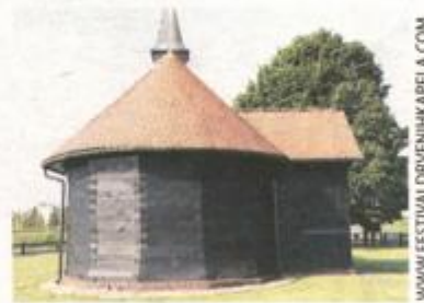
PLEŠKO POLJE: KAPELA RANJENOG ISUSA