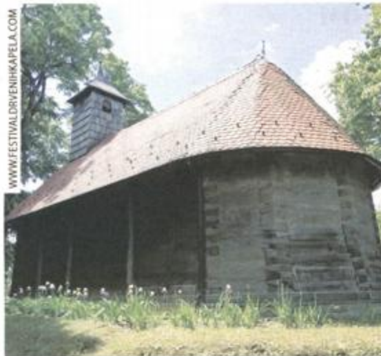
GLADOVEC POKUPSKI: KAPELA PRESVETOG TROJSTVA

SEDAM DANA POVIJESTI: PREDSTAVLJANJE GRADITELJSKE BAŠTINE TUROPOLJA, POKUPLJA I POSAVINE OD 7. DO 14. SRPNJA