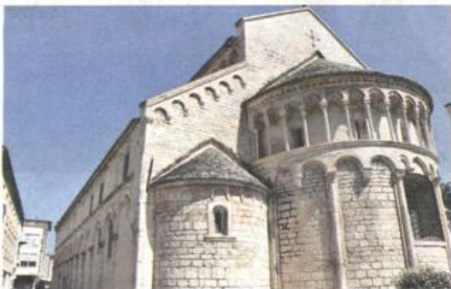
Jedan od najljepših srednjovjekovnih spomenika grada

tauratorski zavod (HRZ), a koje je narednih godina izradio i konzervatorsko-restauratorski elaborat obnove interijera, nastavio je Miletić dodajući kako u sklopu tih radova, tijekom 2019. godine slijede radovi na kamenoj plastici u interijeru i glavnom ulaznom portalu, koji su započeti 10. lipnja postavljanjem zaštitne radne skele na pročelju. Ovogodišnji program, financiran sredstvima Ministarstva kulture kroz pro-