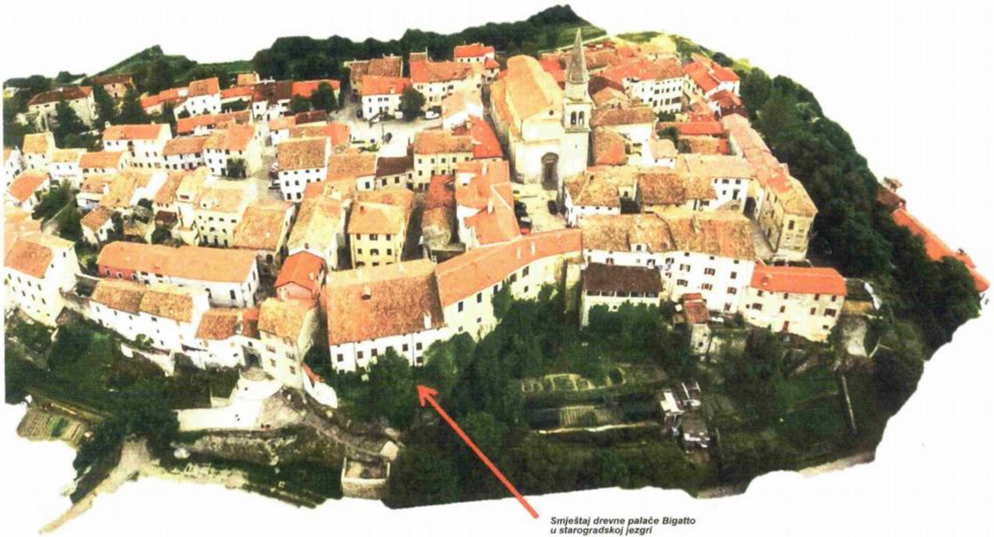
Smještaj drevne palače Bigatto u starogradskoj jezgri

Model JPP-a u Hrvatskoj relativno je slabo prepoznat. U revitalizaciji kulturne baštine još i manje, samo je jedan takav primjer i to u Varaždinskoj županiji, u sklopu kojeg je temeljito obnovljena županijska palača.