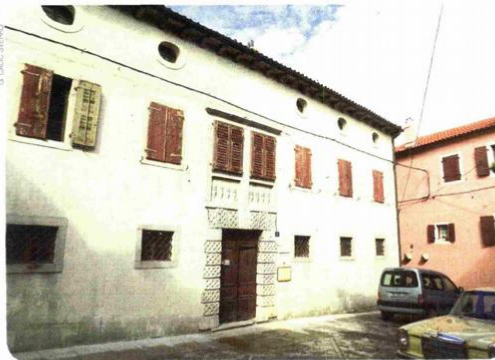
Palača Bigatto, sjedište Zavičajnog muzeja

Preostala četiri objekta unutar stare gradske jezgre, uredila bi se u funkcionalne smještajne jedinice - apartmane. Tri objekta su u lošem stanju i trenutačno nisu u funkciji, dok je jedan u dobrom stanju i za njegovo uređenje nisu potrebni veliki zahvati. Predviđeno je renoviranje objekata uz poštivanje tradicionalnog načina građenja, a njihovim uređenjem će se steći novi turističko - kulturni kapaciteti od tisuću četvornih metara unutarnjih površina i 62 četvorna metra vanjskih površina.