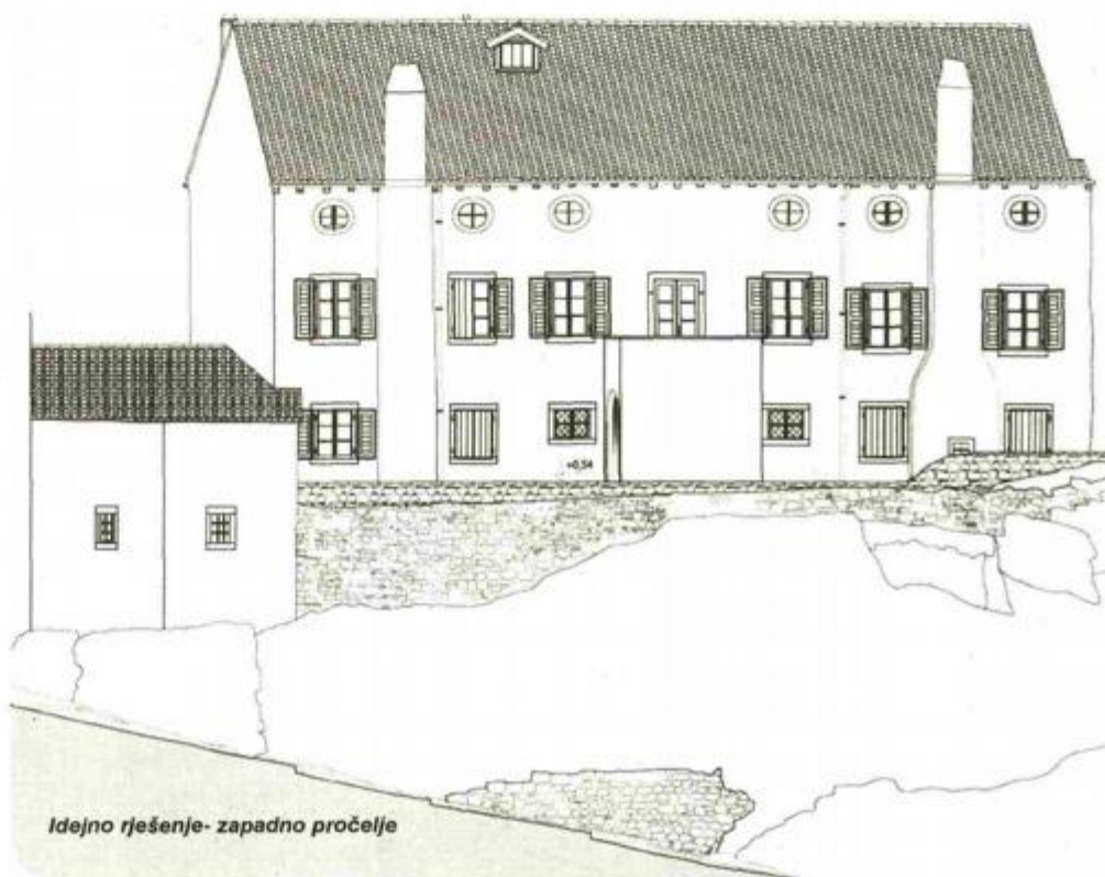
Idejno rješenje- zapadno pročelje

Nedavno je projekt “Difuzni hotel Bigatto” pred-