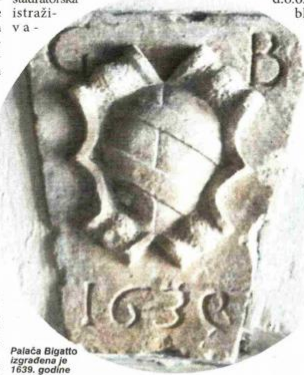
Palača Bigatto izgrađena je 1639. godine