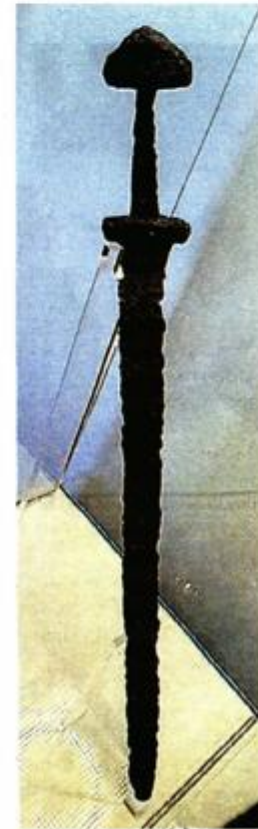
Na nalazištu u Bojni pronađeni su srebrne i pozlaćene ostruge, zlatni novac, mač...

– Zbog malog broja arheoloških nalaza s područja kontinentalne Hrvatske koji mogu datirati u ovo razdoblje i malo povijesnih izvora ovi nalazi pružaju dragocjene podatke. Među nalazima bogato opremljenih pokojnica i pokojnika ističe