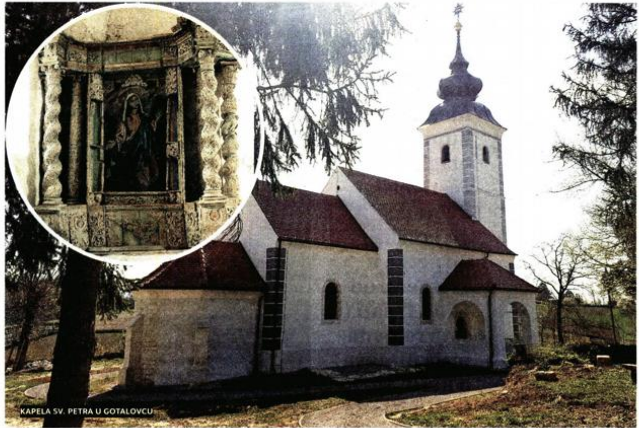
KAPELA SV. PETRA U GOTALOVCU

talovec - objasnila nam je Iva Koci, viši konzervator-restaurator. No, sudbina se s kapelom i oltarima poigrala i u 20. stoljeću. Potres je bio uzrok njihovom privremenom „razdvajanju“. - U tom trenu sve je izgledalo nepopravljivo no to je bilo najbolje što se moglo dogoditi. Da nije bilo potresa, ni kapela, ni oltari ne bi prošli proces konzerviranja i restauriranja - ističe Koci. Dodala je kako svaka umjetnina treba uvjete za dug i stabilan život, a kapela kojoj prijete urušavanje svoda to nije. Možda bi kapela i oltari prije došli na red da nije bilo Domovinskog rata i velike štete koja je nastala na zaštićenoj kulturnoj baštini, ističe restauratorica. Da Gotalovec ima jedinstvene umjetnine dokazuju i dvije izložbe. U Muzeju Mimara je 1994. postavljena izložba