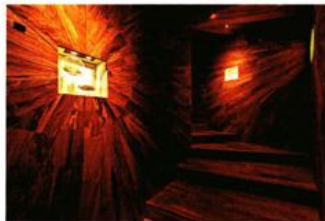
"Šarena soba" je prepoznatljiv dio muzeja koji je u ulozi projekcijske dvorane