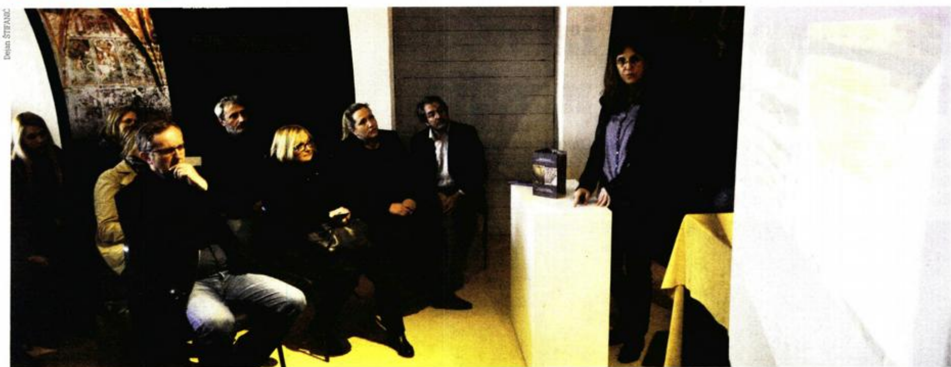
Predstavljanje je održano u Povijesnom i pomorskom muzeju Istre